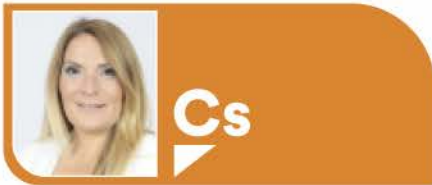
MÓNICA COBO MAGAÑA. PORTAVOZ CIUDADANOS