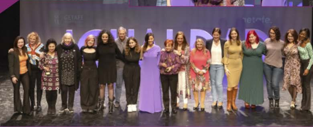
Entrega de los Premios 8 de marzo, en el Teatro Federico García Lorca, con la voz unánime de ‘¡Viva la lucha de las mujeres!’ en su XXVI edición