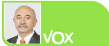
JOSÉ MANUEL FERNÁNDEZ TESTA. PORTAVOZ VOX

Nuestros vecinos no necesitan más problemas, necesitan políticos comprometidos que ofrezcan soluciones reales. Y a eso hemos dedicado todo nuestro esfuerzo durante esta legislatura y lo seguiremos haciendo para hacer del futuro de Getafe la ciudad que mereces. —