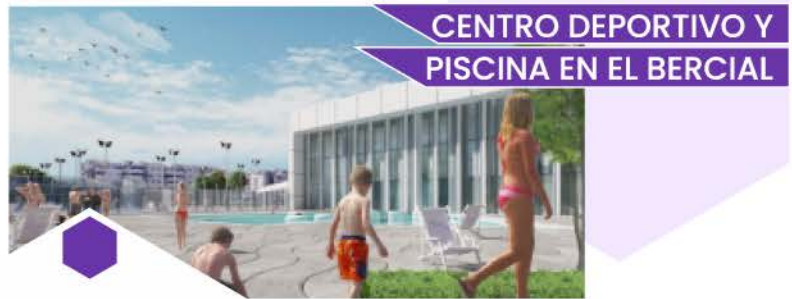
CENTRO DEPORTIVO Y PISCINA EN EL BERCIAL

El edificio también será un Centro cívico, con un salón de actos con capacidad para 150 personas, con 3 salas multiusos para talleres y actividades, lo que permitirá contar con nuevas infraestructuras sociales a un barrio en continuo crecimiento.