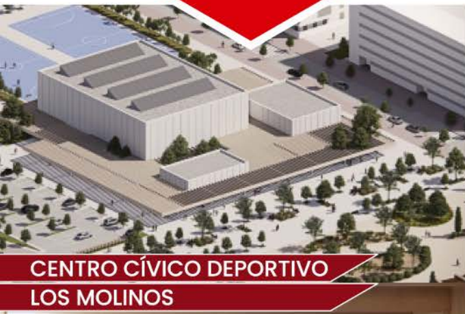
CENTRO CÍVICO DEPORTIVO LOS MOLINOS

Estamos trabajando en las infraestructuras que necesita una gran ciudad en continuo crecimiento. Bibliotecas, piscinas, centros deportivos y sociales, nuevos recintos para grandes eventos o el gran espacio natural Getafe Río son nuestros objetivos más próximos. Unos proyectos que han nacido de la firme voluntad de mejorar constantemente la vida de los vecinos y vecinas de Getafe.