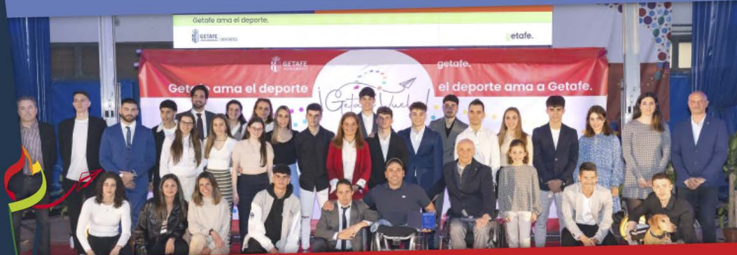
GETAFE RECONOCIÓ EL ESFUERZO DE SUS MEJORES DEPORTISTAS EN UNA GALA QUE NO SE CELEBRABA DESDE LA PANDEMIA