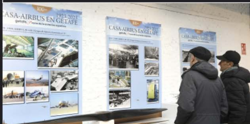
EXPOSICIÓN RETROSPECTIVA DEL CENTENARIO DE CASA-AIRBUS A CARGO DE AMIGOS DEL MUSEO DE GETAFE Y AGRUPACIÓN DE JUBILADOS DE CASA