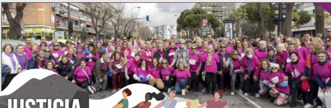
La Carrera Popular por la Igualdad cumplió su XXIX edición