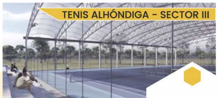
TENIS ALHÓNDIGA - SECTOR III

El proyecto se encuentra en fase de redacción.