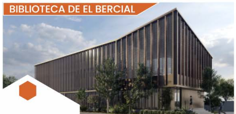
BIBLIOTECA DE EL BERCIAL

Se trata de una novedosa instalación, que incluiría piscina exterior con pradera, además de salas deportivas a las que se trasladaría entre otros aspectos la Oferta Física de Adultos. Este nuevo centro deportivo se situaría en una parcela de 16.000 m 2 junto al actual Polideportivo de El Bercial y también contará con una amplia oferta para deportes de raqueta.