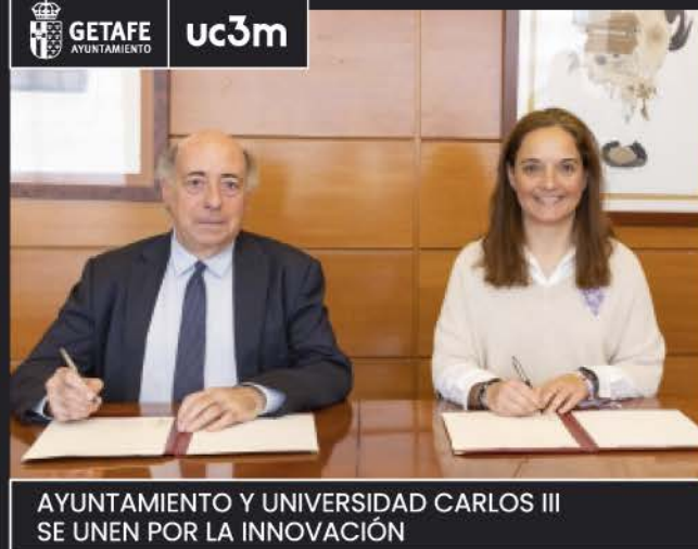
AYUNTAMIENTO Y UNIVERSIDAD CARLOS III SE UNEN POR LA INNOVACIÓN