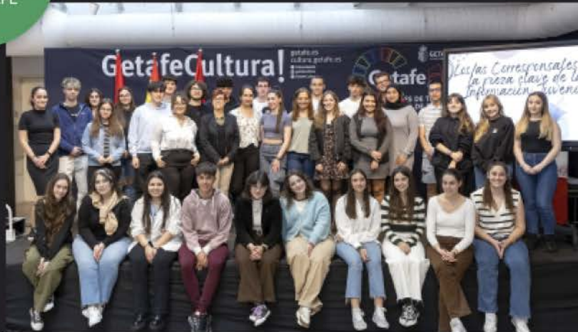
LOS PREMIOS ENRÉDATE RECONOCEN EL TRABAJO DE LOS CORRESPONSALES JUVENILES EN LOS CENTROS EDUCATIVOS