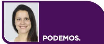
ALBA LEO PÉREZ. PORTAVOZ PODEMOS

En Getafe seguimos trabajando en un futuro ilusionante, que se construye con la ayuda de todos, sin dejar a nadie atrás.