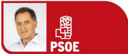
HERMINIO VICO. PORTAVOZ PSOE