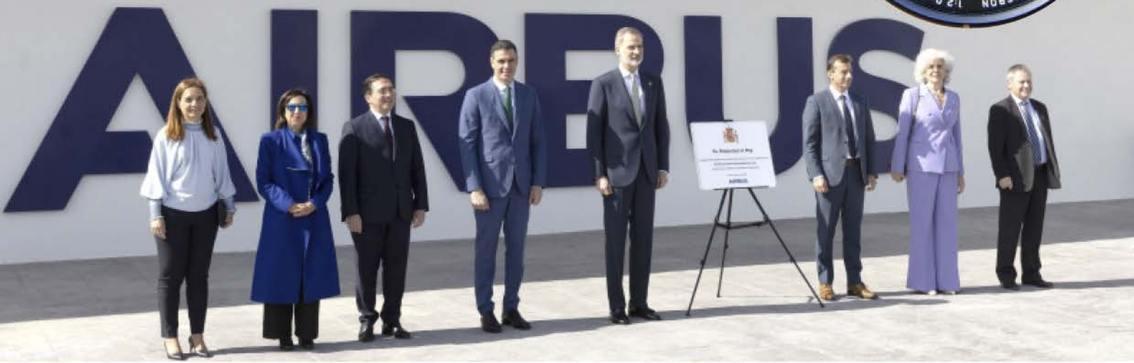
EL REY Y EL PRESIDENTE DEL GOBIERNO VISITARON AIRBUS CON MOTIVO DEL 100 ANIVERSARIO DE CASA