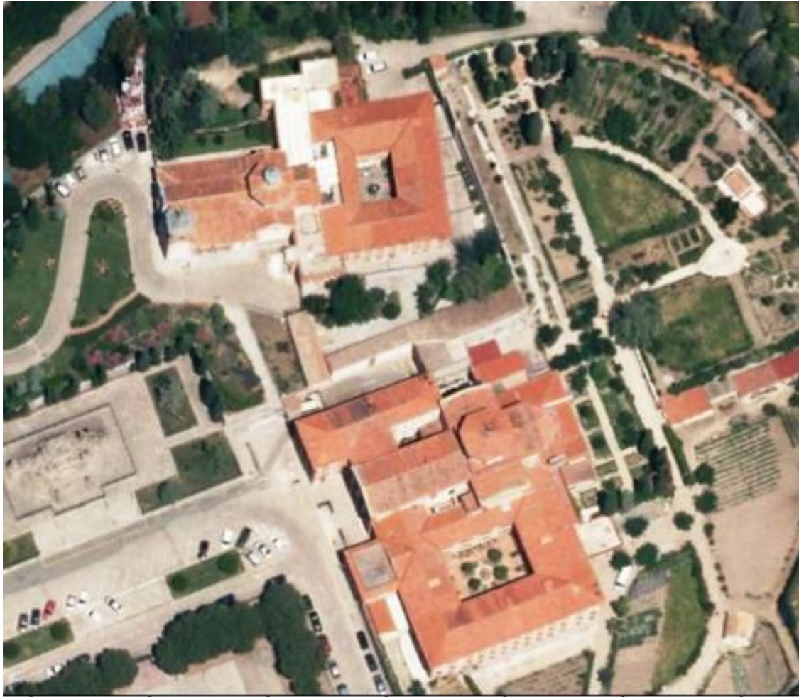
EL SEGUNDO CONVENTO ANEXO A LA ERMITA.