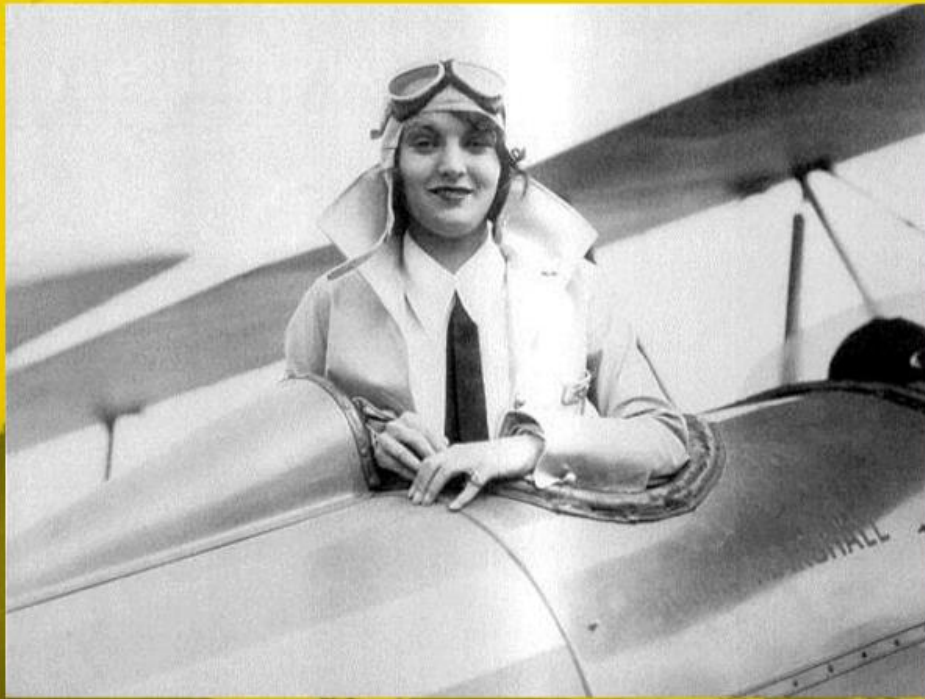
HABLEMOS DE GETAFE- Sesión 27 febrero 2014