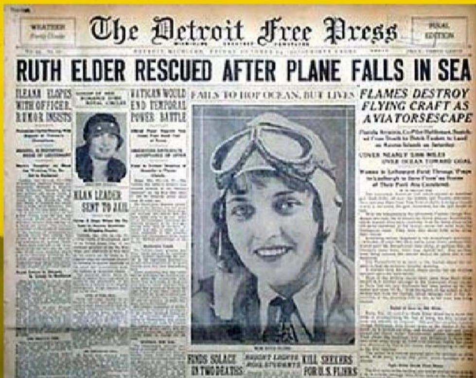
HABLEMOS DE GETAFE- Sesión 27 febrero 2014