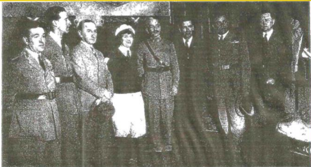
LISBOA. EN EL PALACIO DE LA PRESIDENCIA DE LA REPUBLICA

HABLEMOS DE GETAFE- Sesión 27 febrero 2014