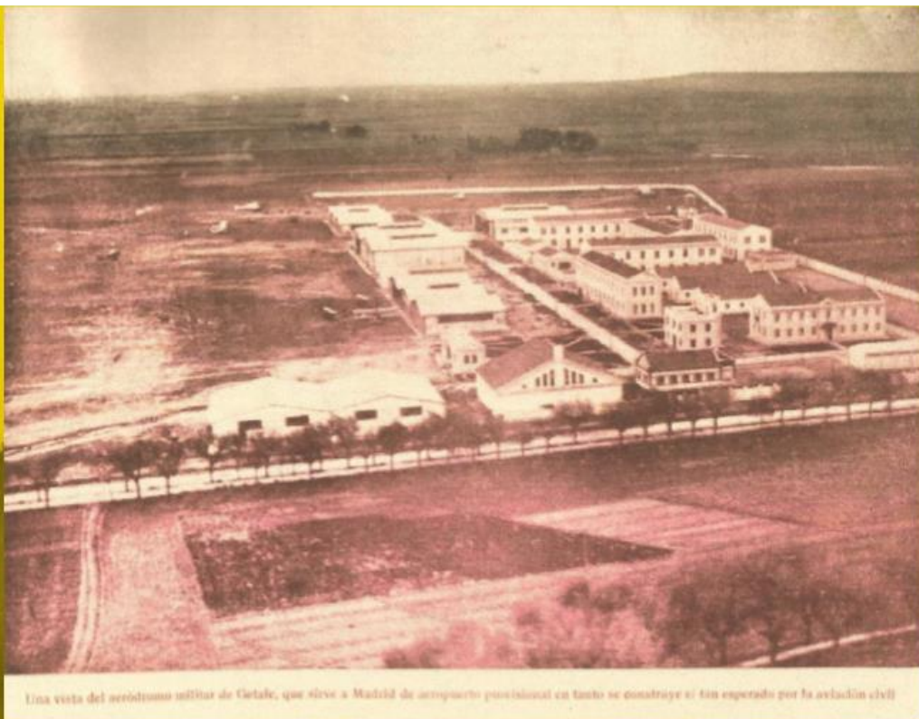
Una vista del aeródromo militar de Getafe, que sirve a Madrid de aeropuerto provisional en tanto se construye el tan esperado por la aviación civil

HABLEMOS DE GETAFE- Sesión 27 febrero 2014