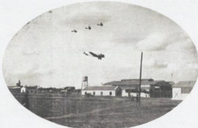
El Vickers en que Miss Ruth Elder vuela sobre el aeródromo de Getafe, escoltado por una escuadrilla de aviones militares.