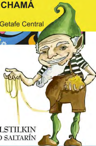
RUMPELSTILKIN EL ENANO SALTARÍN