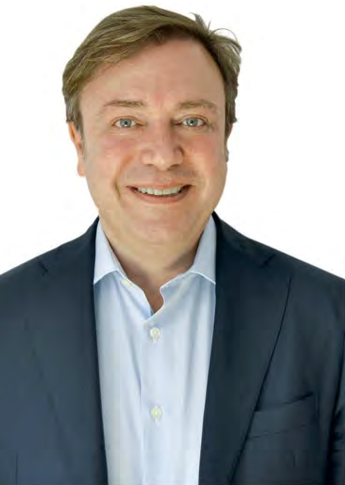
Juan Soler , Alcalde de Getafe

Getafe recupera su atributo cultural conmemorando los 200 años de fantasía de los hermanos Grimm. Los emblemáticos cuentos infantiles como Caperucita Roja, Hansel y Gretel, La Cenicienta, Blancanieves y muchos más cobrarán vida en nuestro tradicional Desfile de Carrozas dando el toque de magia e ilusión a las Fiestas Patronales de 2013.