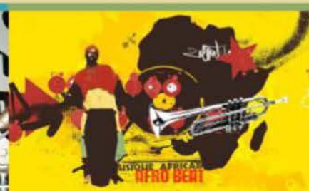
ALMA AFROBEAT RADIO 3