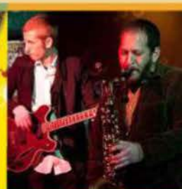
THE FIRE EATERS