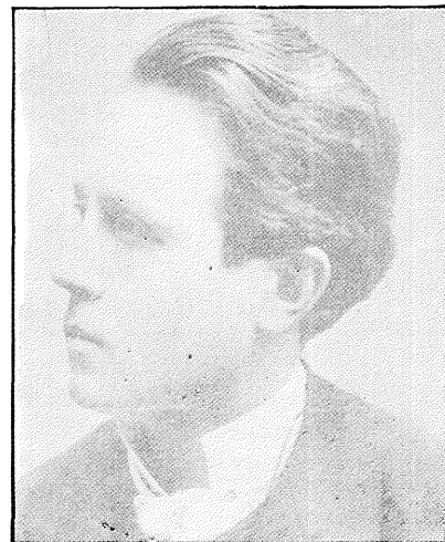
Azorín, en 1897