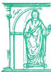
Santa María Magdalena