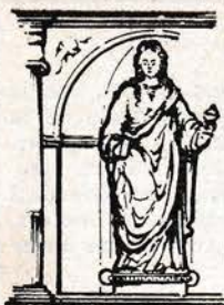
Santa Maria Magdalena