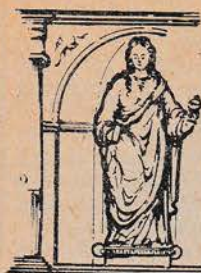
Santa Maria Magdalena