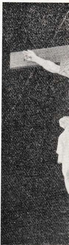
El Cristo de la M... ya? o es que se in... encargo? ¿Acaso p...

Hay en Toledo una antiquísima Cofradía que debe su origen nada menos que a Ruy Díaz de Vivir, el Cid Campeador. Se llama "de la Vera Cruz" y la asentó el famoso castellano en la