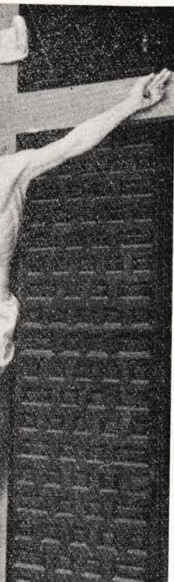
ia.—¿Se ha muerto a decirme su último beso su último beso?

Vigilia Pascual, a las once de la noche. Confesiones: por la tarde, desde las ocho.