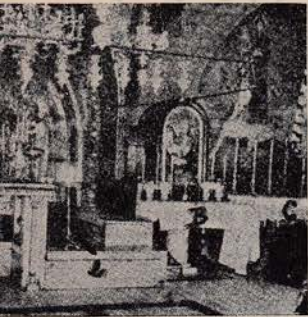
de la Cruz y Muerte del alén. (Foto 3.)

la Virgen estuvo al pie de la cruz mientras en ella moría su Divino Hijo; desde aquí le oyó decir: "Ahí tienes a tu hijo." Sobre un trozo de la desnuda piedra se apoya en parte este altarcito. Es el lugar más cercano al de la muerte de Cristo; allí podemos decir misa y allí me cupo la suerte, inmerecida e inolvidable, de celebrarla yo en la mañana del 4 de octubre; por privilegio se dice la misa de la Virgen de los Dolores.