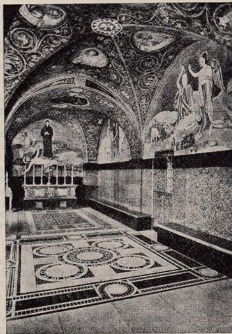
Capilla de la Crucifixión en el Monte Calvario. Jerusalén. (Foto 2.)

Si en la Semana Santa no entran los Oficios Divinos ¡vaya una Semana Santa! Mejor que los Oficios Divinos, no hay nada en Semana Santa.