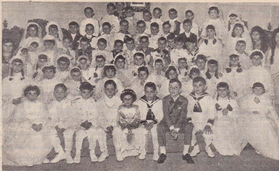
Estos son los niños y niñas de los grupos escolares de «J. J. Barrilero» y «Santa María Magdalena», que el día de la Ascensión de este año (26 de mayo), hicieron su primera comunión. Un poco ha tardado en venir su retrato en estas páginas, pero, de seguro, que ahora estarán más satisfechos, buscándose aquí y recordando muchas cosas gratas de aquel día.