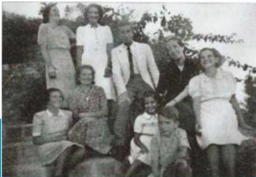
LA FAMILIA ANTES Y DESPUÉS DE LA MUERTE DEL PADRE EN 1.936.