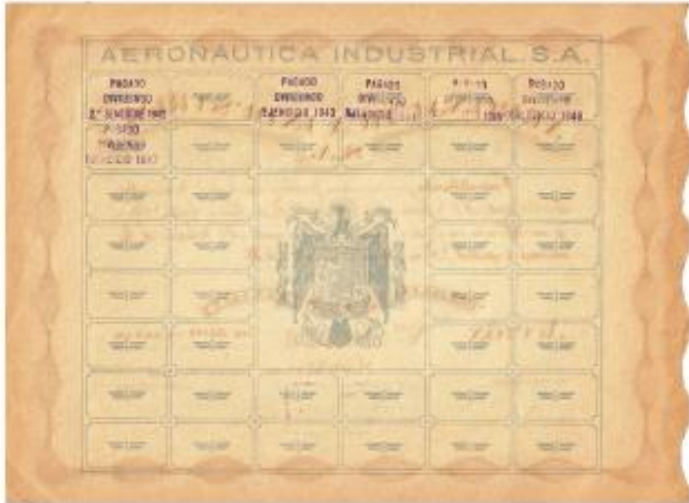
ACCION DE A.I.S.A. DE 1.941 - REVERSO