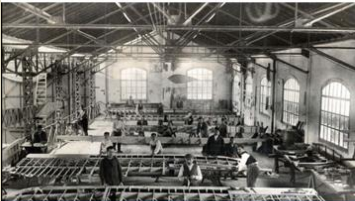
EXTERIOR E INTERIOR DE LA FABRICA DE CARABANCHEL