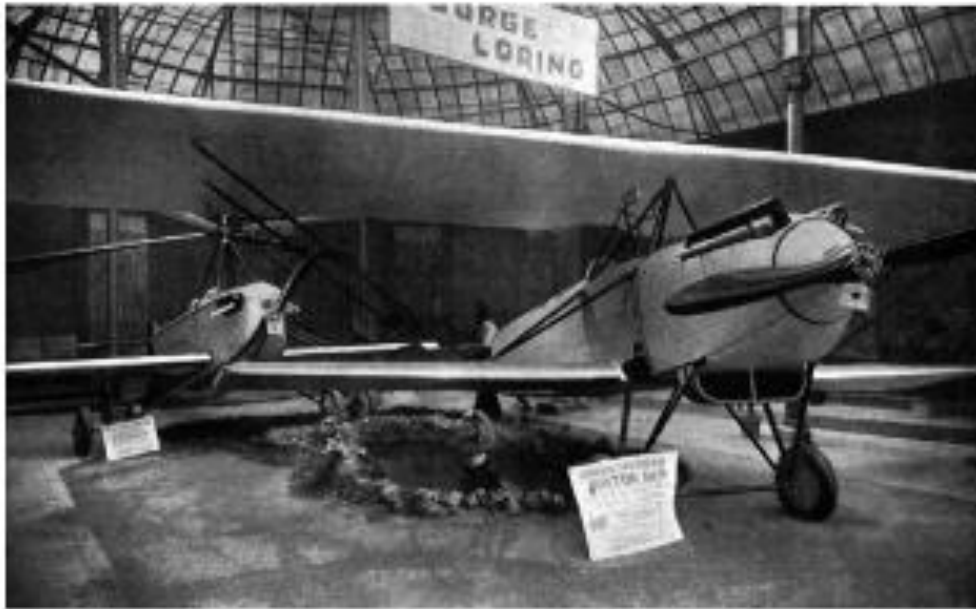
EXPOSICION EN EL RETIRO EN 1.926