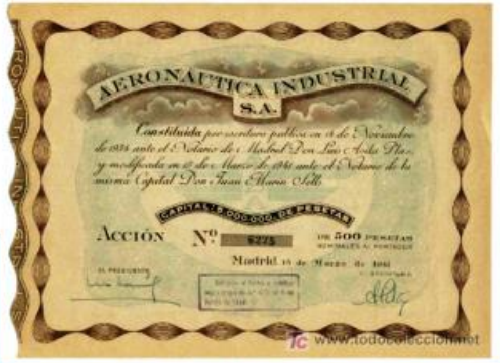
ACCION DE A.I.S.A. DE 1.941 - ANVERSO