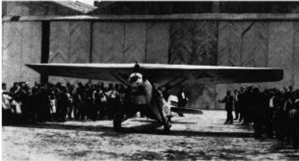
MODELO LORING E II QUE VIAJO A MANILA