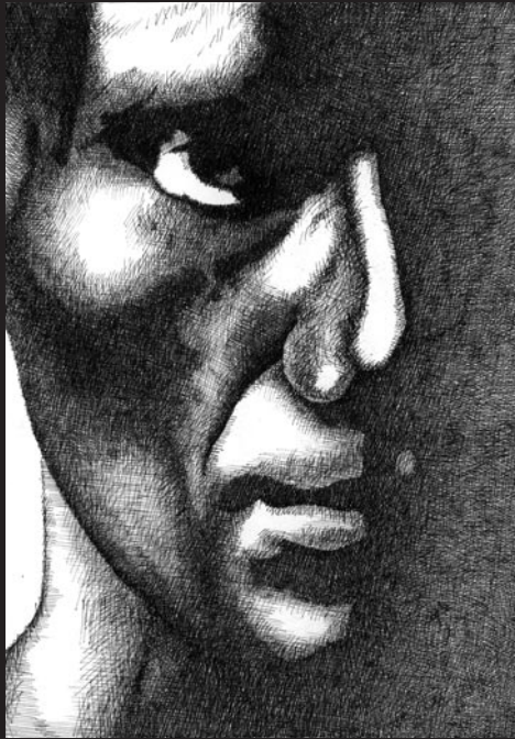
Dibujo: Patricio Caba