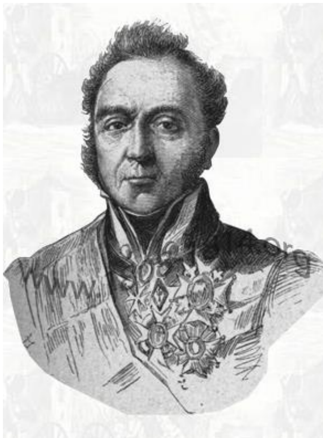
CARLOS JOSÉ ENRIQUE, CONDE DE ESPAÑA.