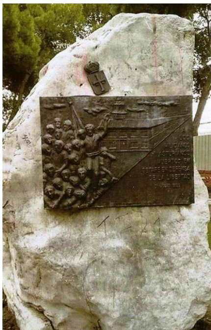
MONUMENTO A LOS MILICIANOS ASTURIANOS MUERTOS EN GETAFE (HOY DESAPARECIDO)