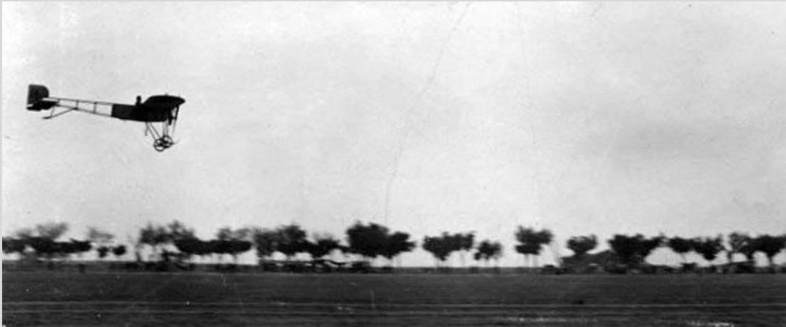
Aterrizaje de Vedrines en Getafe

La aviación comercial nace en España alrededor de 1928, con el vuelo del BREGUET 26T, de CASA, pilotado por Gómez Spencer, capaz de transportar seis pasajeros con sus equipajes correspondientes. En este avión el piloto estaba separado del pasaje por el depósito de combustible. Hasta ese momento el objeto de la aviación había sido deportivo y militar, ahora pasa a ser también comercial.