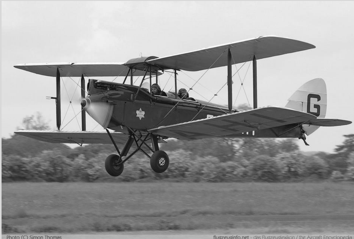
Avioneta de entrenamiento HAVILAND MOTH