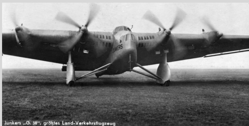
JUNKER G 38

Un hito importante para Getafe fue la llegada del avión de mayor tamaño del mundo, en ese momento, el JUNKER G 38, que aterrizó procedente de Barcelona. Era un cuatrimotor de 44 metros de envergadura, con capacidad para 26 pasajeros en la cabina principal, otros 2 en la proa y tres en cada una de las cabinas situadas en el borde del ataque de sus alas y que disponían de ventanillas. Se había bautizado con el nombre de DEUTSCHLAND y era propiedad de LUFT-HANSA.