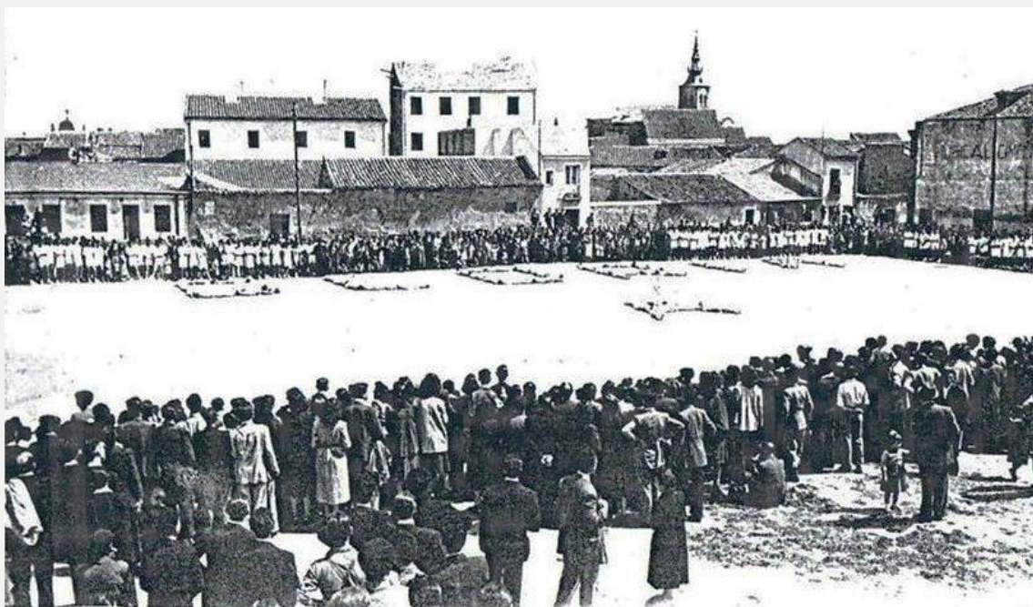
Panorámica de la finca adquirida por Don Antonio "El Registrador" en la calle Don Fadrique y todas las adyacentes, para tener una idea de su extensión.

Al jubilarse, se trasladó a Madrid, fijando su residencia en el número 3 de la Puerta del Sol, lugar donde falleció el día 20 de Abril de 1917. ( Del artículo "Hurgando en Historia", original de Marcial Donado, editado en el periódico Getafe Express. )