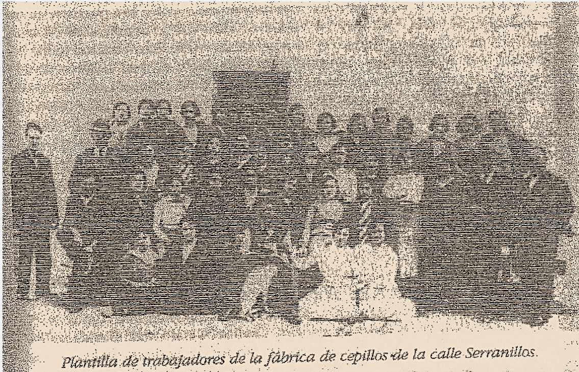
Plantilla de trabajadores de la fábrica de cepillos de la calle Serranillos.