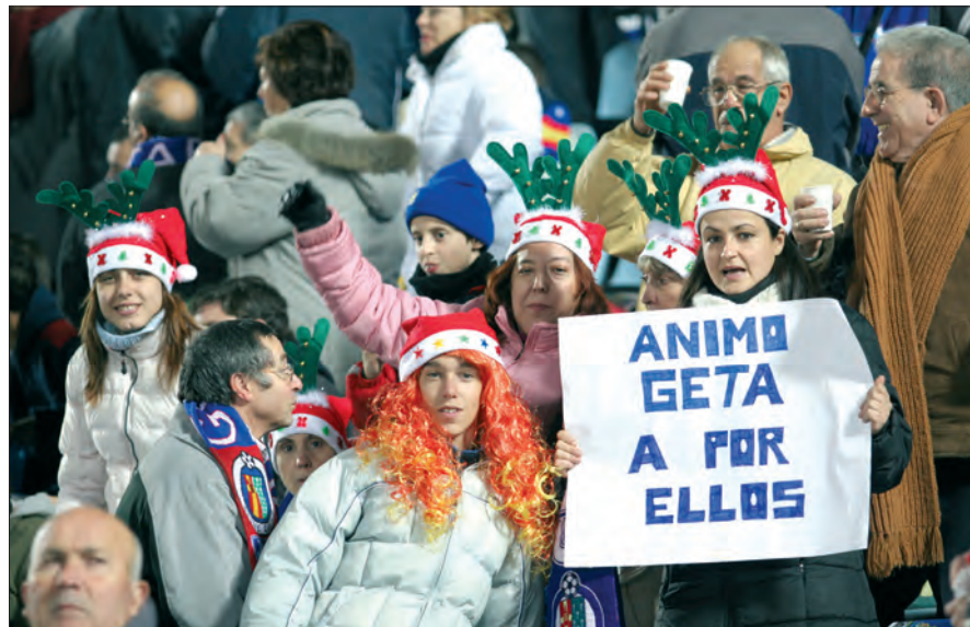
Pitufos con gorros azules y renos (no se sabe si a sueldo de Papá Noel) pusieron color a las gradas de un Coliseum Alfonso Pérez que, a tono con las fechas, se vistió de fiesta. Porque sólo el fútbol y la Navidad en conjunción podrían dejar imágenes tan singulares, en las que las pelucas multicolores y las tradicionales bufandas fueron otros de los complementos elegidos por la afición. De esa guisa y con un cartelón de ánimo al equipo se vivió el último partido de Liga del año frente al Sevilla.