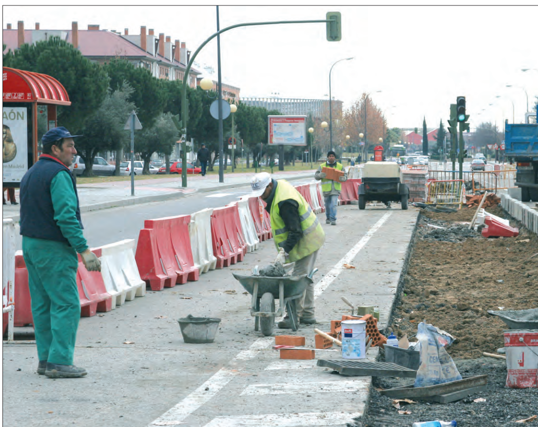
Plantación de árboles en la ctra. a Villaverde, dentro del plan de embellecimiento de la ciudad.

Las políticas de vivienda son otro de los puntos fuertes de este presupuesto. En la actualidad la Empresa Municipal del Suelo y la Vivienda (EMSV) está desarrollando varias promociones de viviendas de protección oficial (VPO). Próximamente, en Los Molinos y Cerro Buenavista construirá 1.000 protegidas. Este desarrollo