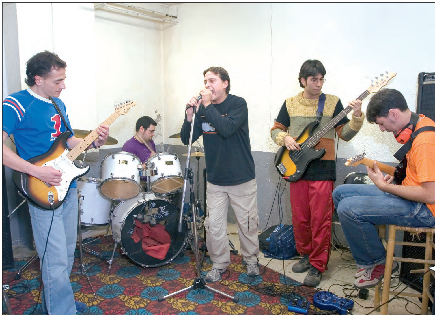
El grupo Total Petición en el local de ensayo de la Casa de la Juventud.