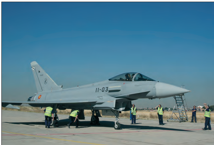
El caza europeo Eurofighter.