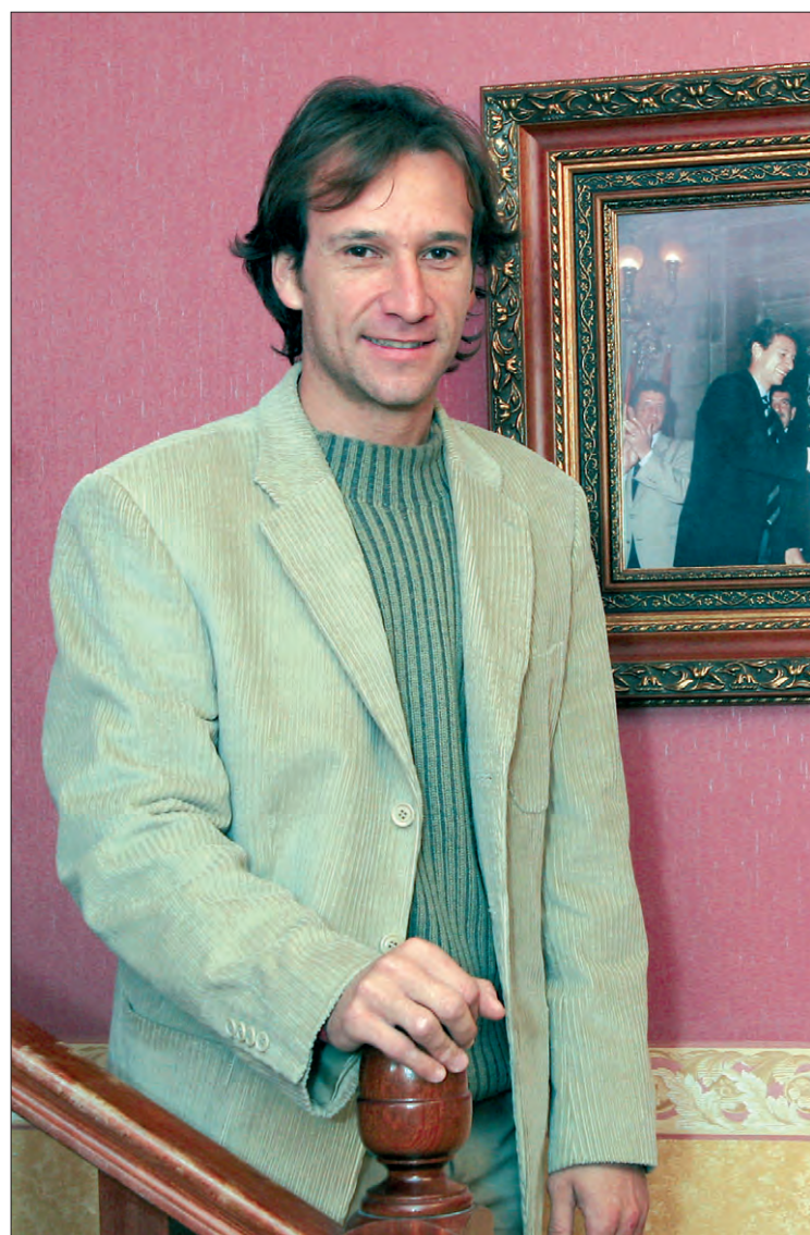
Alfonso Pérez, antiguo futbolista profesional.