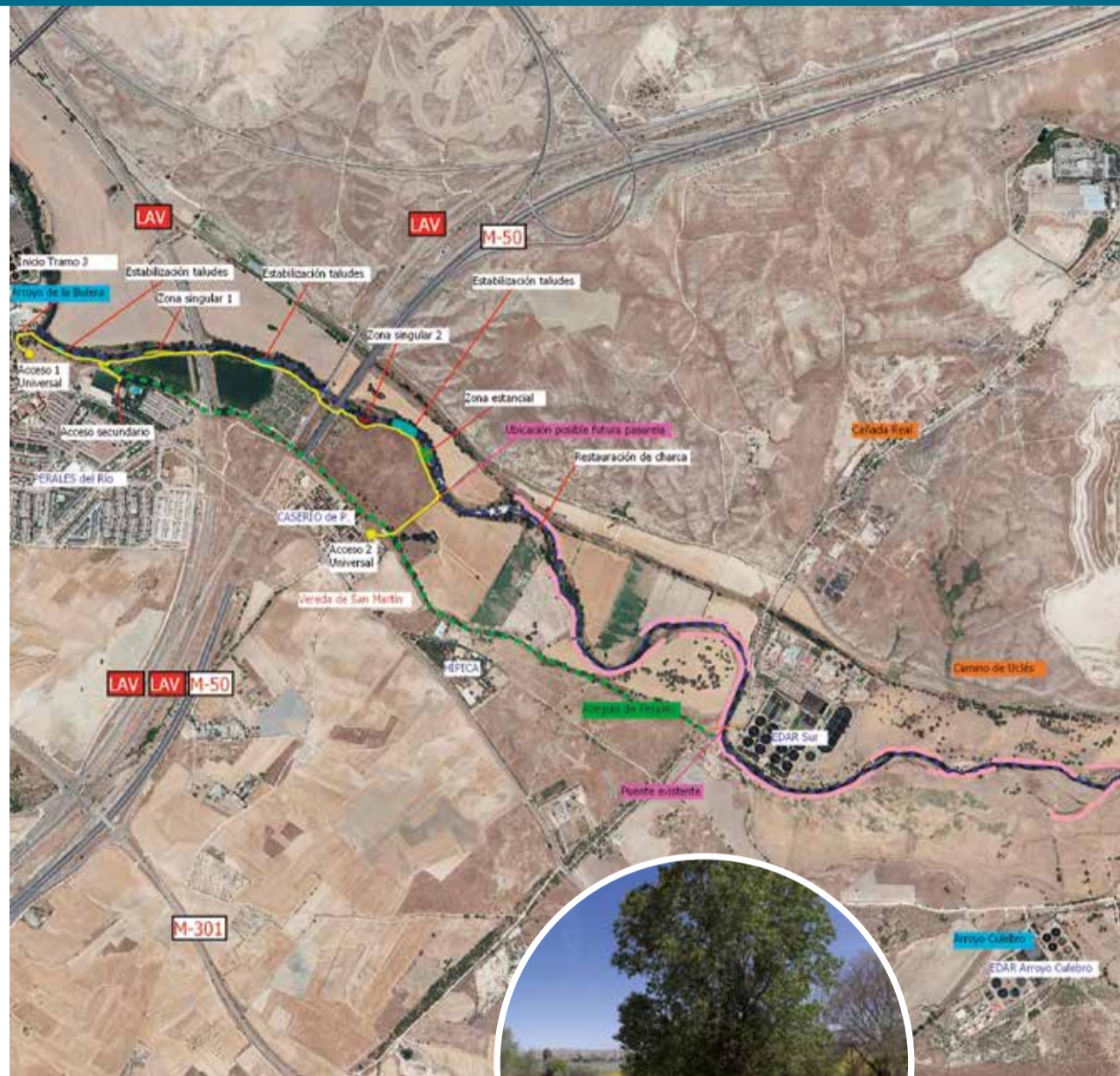
Mapa del ámbito de actuación de Getafe Río en sus diferentes fases.

Ahora ya ha comenzado la renaturalización de la zona y “estamos hablando de 37.000 árboles y arbustos”. Las primeras plantaciones fueron colaborativas, porque “tenemos que ser partícipes y dar a conocer el