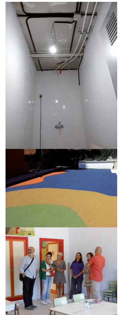
CEIP Jorge Guillén.

luminarias “que ahora cuentan con sistemas más eficientes de tecnología LED”. Y además se han renovado patios, creado porches... en total solo en este 2022 se han invertido 5 millones del total de 13 que componía el Plan Colegios. Durante los meses estivales se han acometido obras en 30 colegios.