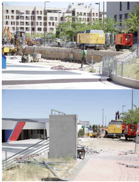
CEIP Miguel de Cervantes.