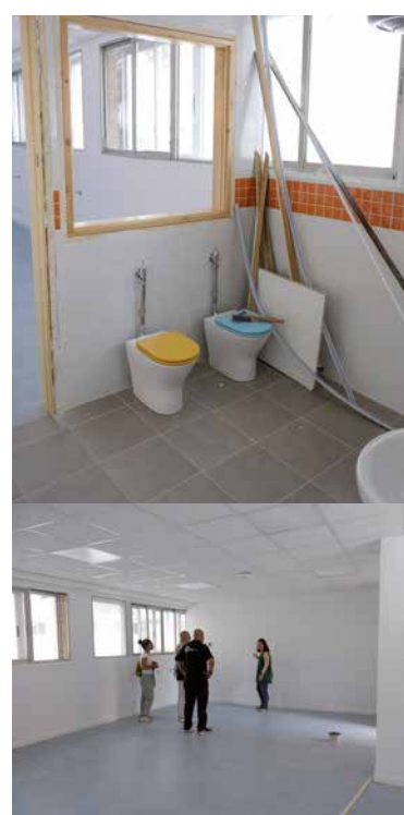
CEIP Ciudad de Getafe.