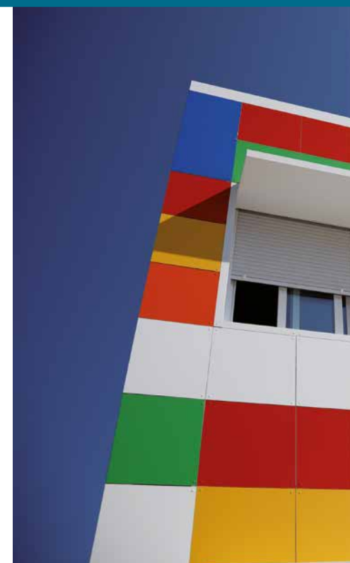
CEIP Santa Margarita María de Alacoque.

Por ese motivo también han cambiado ventanas, fachadas, o las