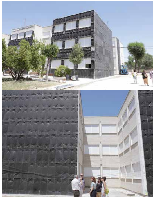
CEIP Santa Margarita María de Alacoque.