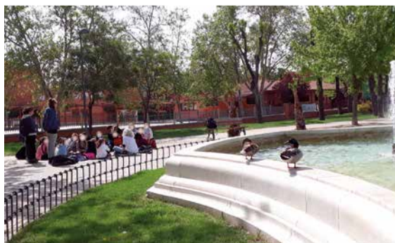
CEIP Miguel Hernández en el parque de El Greco.