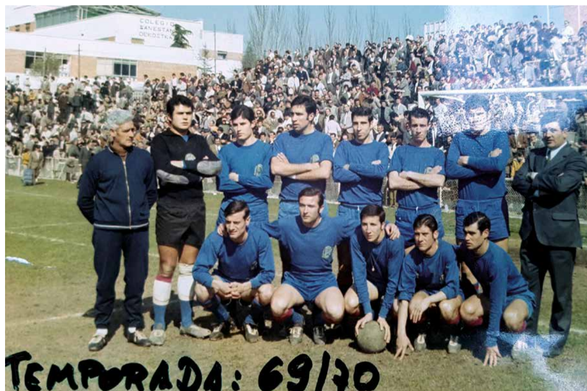
Azulones temporada 69-70.