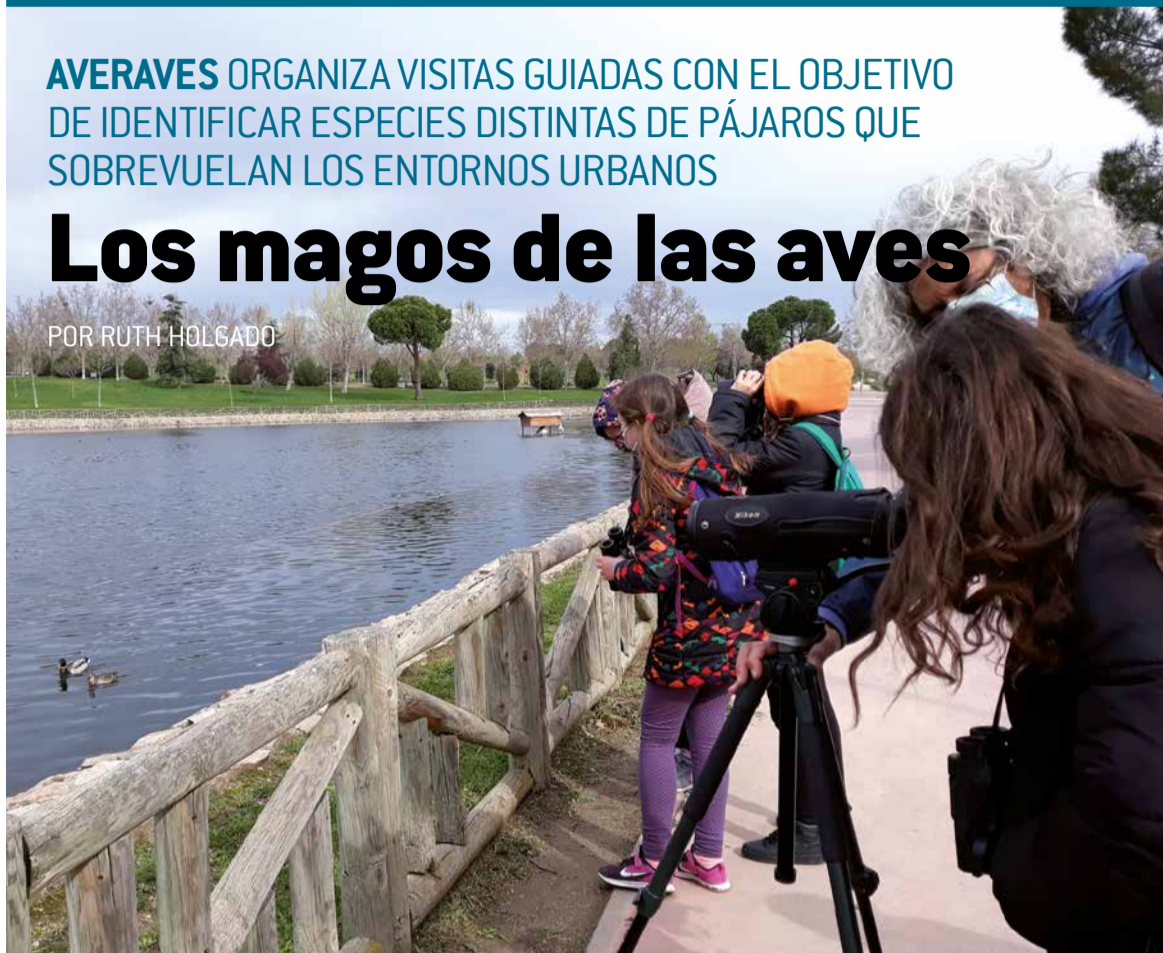
IES Altair en el parque de La Alhóndiga.