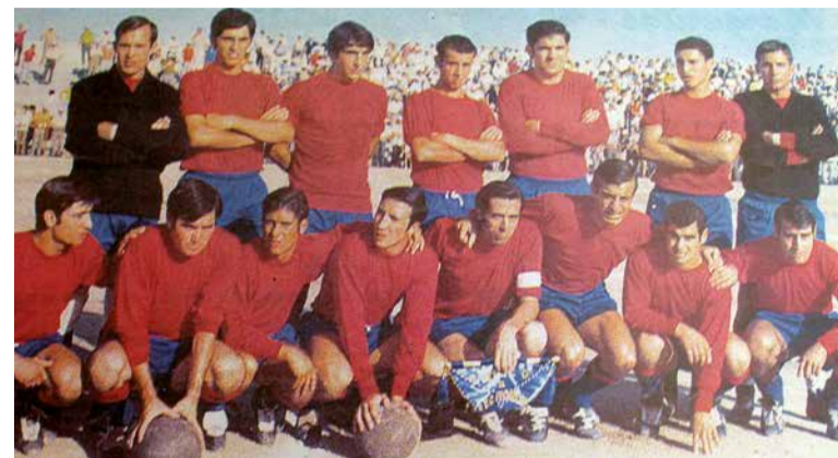
Debut en Las Margaritas iban de rojo porque los rivales no trajeron otra equipación.

Las Margaritas era en aquellos años su segunda casa. Cuando todavía estábamos en Regional Serrano recuerda la desaparecida Copa Ramón Triana. Esa temporada le sacamos 12 puntos al Real Madrid. Teníamos un equipazo. Llegó el día de la final, aquí empatamos a 3 y allí empatamos a