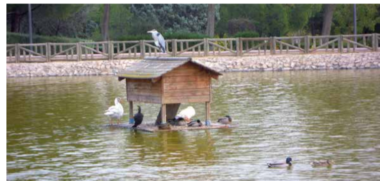
Garza, oca, cormorán, ánade y almizclero en parque Alhóndiga.

En la caseta que hay en el estanque del Parque de la Alhóndiga “hemos llegado a ver hasta 4 especies diferentes: resulta que posada sobre su tejado había una garza real, al lado un cormorán, también una oca y un ánade azulón o pato de collar. A veces incluso se posan gaviotas reidoras”. Queda demostrado que no solo hay patos allí”, apunta Javier. El poder ver en los entornos urbanos hasta dos especies de pájaros carpinteros, el pito real y el pico picapinos “a