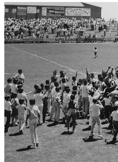
Uno de los míticos ascensos a Segunda en Las Margaritas.

Muchos recuerdan hoy sus gritos desde el banquillo. Con el cigarrillo en la mano no tenía campo para correr el jugador que no le hiciera caso. Entrenador temperamental, a lo Camacho, no hay campo en la Comunidad de Madrid que él no haya recorrido. De todos ellos, atesora multitud