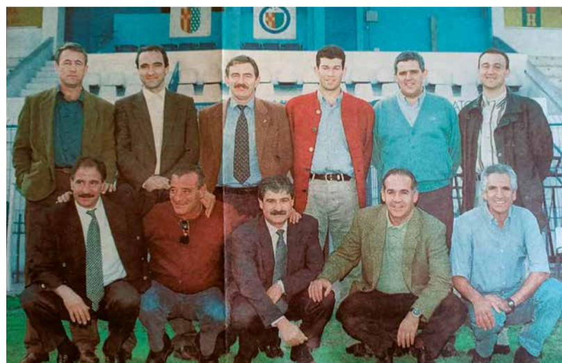
MARCA eligió a un once histórico del Getafe y los reunió en torno a Las Margaritas para despedirse del campo en el que habían hecho historia, un día antes de su derribo.