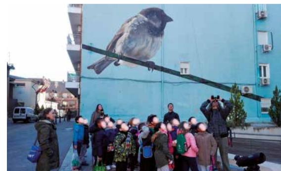
CEIP Sagrado Corazón alrededor del cole.