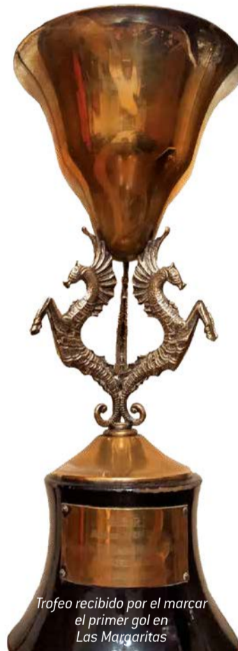
Trofeo recibido por el marcar el primer gol en Las Margaritas

“Empiezo a jugar en el Getafe en Tercera en San Isidro hasta que en la temporada 70-71 inauguramos Las Margaritas. Metí el primer y el segundo gol. El primero fue un remate de un compañero, dio en el poster y yo solo tuve que empujarla, o sea que hice poco. El segundo fue un gol olímpico. Allí jugué 3 años hasta que volví a Carabanchel. Me cansé de jugar medio en serio y formamos un equipo de veteranos en Uralita en un césped que no lo había en el sur. Teníamos 33-34 años, una buena edad para quitar el vicio y luego al tercer tiempo. Nos íbamos al Norte y cortábamos la calle, toda la plantilla, las mujeres y los niños... Y nunca ningún coche pilló a nadie. Al tercer año en Uralita me convertí en el entrenador y al cuarto año la empresa se cargó el equipo. Llegó el Getafe y me dijo vente para acá a entrenar a los juveniles. Y así empecé hasta que pasé al amateur y de ahí fui subiendo”.