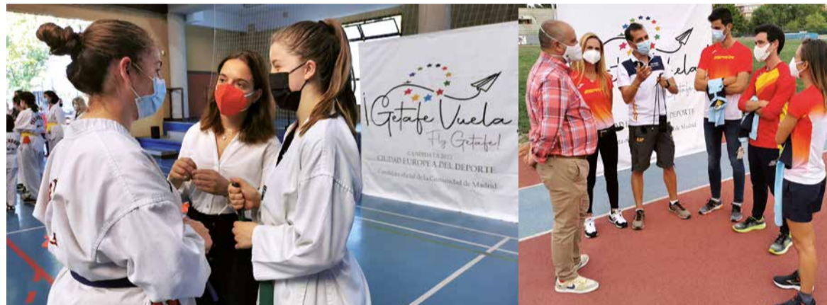
La alcaldesa y el concejal de Deportes llegan meses traslándole a los deportistas locales la candidatura de Getafe a Ciudad Europea del Deporte 2022.

En cuanto a programas deportivos municipales, está la Oferta Física de Adultos, con 20 modalidades de actividad física; 166 clases y 4.982 plazas ofertadas. Las Escuelas Deportivas, con 29 modalidades deportivas y de actividad física; 206 clases y 4.423 plazas ofertadas. La