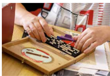
Imprentilla que usaban las camaradas del Movimiento Democrático de Mujeres.