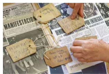
Las tablillas que los familiares de los presos políticos colgaban en los cubos en sus vistas al penal.