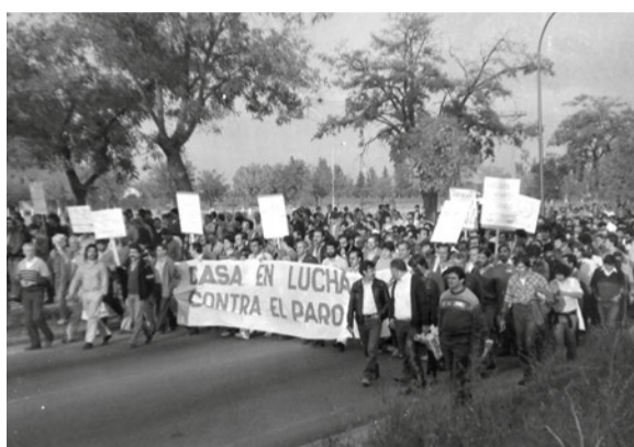
Trabajadores de Construcciones Aeronáuticas en lucha por sus derechos.