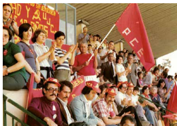
Público asistente a un mitin de Santiago Carrillo en el estadio de fútbol de Las Margaritas.