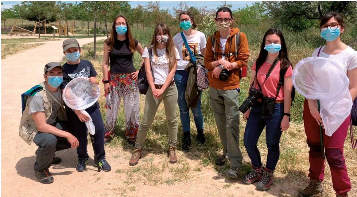
Miembros de la Asociación AsBio participando en un censo de mariposas.

POR RUTH HOLGADO / FOTOGRAFÍAS E INFOGRAFÍAS: ASBIO