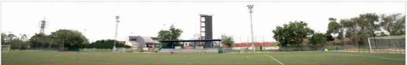
Polideportivo Giner de los Rios