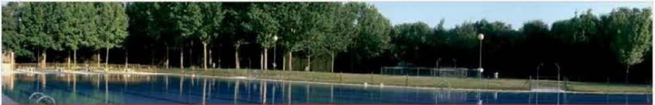
Piscina Perales del Rio