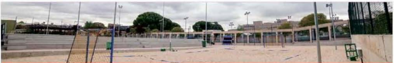
Polideportivo Alhondiga-Sector III