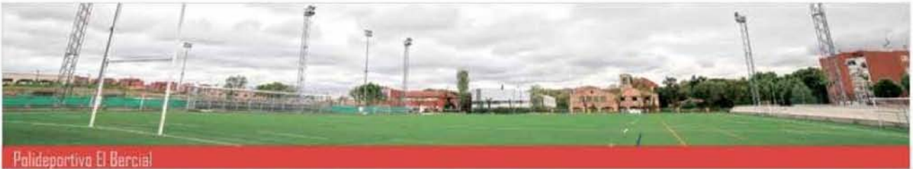
Polideportivo El Bercial