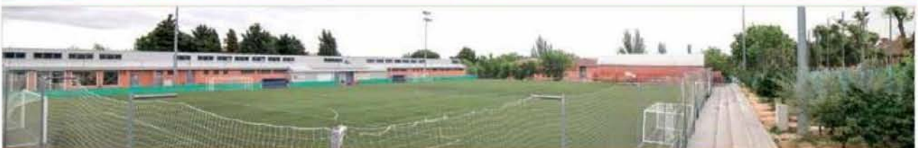
Polideportivo Rosalia de Castro