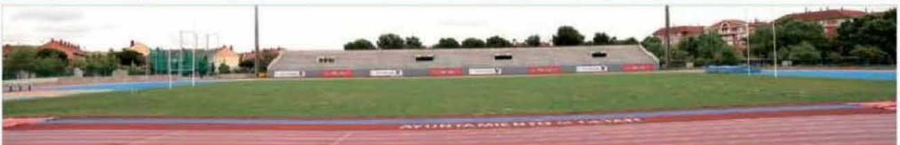
Polideportivo Juan de la Cierva