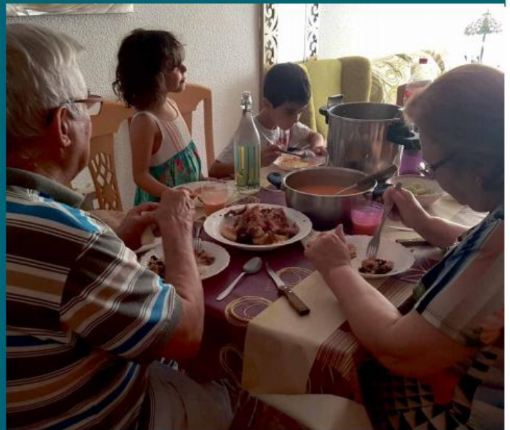
Abuelos y nietos comen juntos un día de verano.

Los más pequeños de la casa inauguraron el paso viernes oficialmente sus vacaciones de verano. Terminó el colegio, llegó el calor y para muchas familias el drama: ¿Qué hacemos con los niños? ¡Benditos abuelos! Gracias a su inestimable ayuda muchos padres y madres pueden compatibilizar sus trabajos con las vacaciones de los niños. "Mi hija y mi yerno solo disponen de 15 días libres en verano y sus dos hijos, mis nietos, de dos meses. Sus salarios son bajitos así que toca arrimar el hombro ya que no se pueden permitir los campamentos privados". Sí los públicos que pone en marcha el Ayuntamiento en los colegios. "Pero haremos el esfuerzo para que no madruguen y pasen calor".