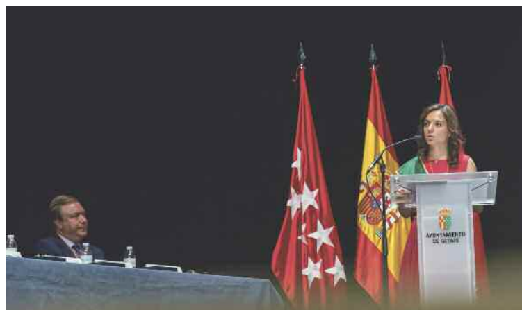
El alcalde saliente, mira a la nueva alcaldesa durante su intervención.