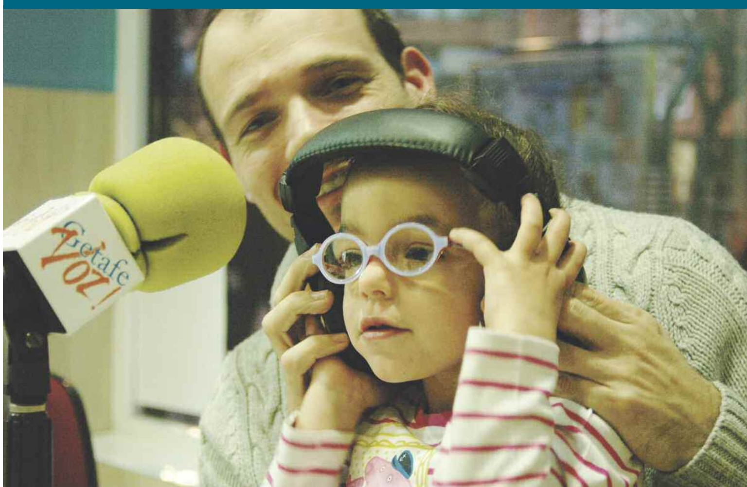
Getafevoz, un espacio abierto para todos.

Hemos acumulado miles de horas de radio a través de Internet y, gracias a la tecnología, son muchas las personas que nos han escuchado en cualquier parte del mundo. Damos las gracias de corazón a los muchos realizadores, guionistas, invitados, técnicos y colaboradores que han dedicado una importante parte de su existencia a entretener, informar o exponer sus opiniones. Y mostramos nuestro reconocimiento a todos los oyentes que han invertido su valioso tiempo en escuchar los debates, noticias y mensajes de sus vecinos, participando a veces directamente en los programas. Ahora, sin embargo, planteamos el cierre de la emisora. Una decisión de la que no nos sentimos satisfechos. Como sucede en muchos proyectos asociativos, no hemos podido, o no hemos sabido –por el momento– involucrar a los socios en la gestión del proyecto, aunque confiamos en encontrar voluntades que lo lleven adelante, con otro nombre o con otras propuestas.