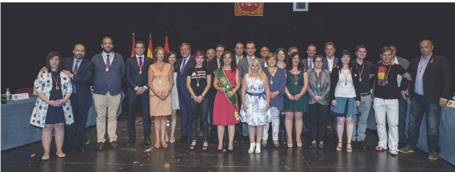
Foto de la corporación municipal al completo.