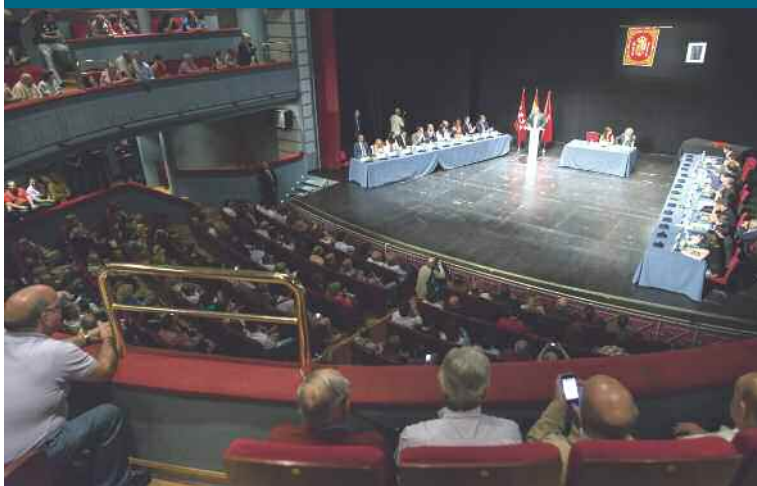
El teatro García Lorca estaba a rebosar.

Que no se le olvide a nadie que cinco años después volvió a ganar y recuperó el Gobierno". Y dejó un recado para los que tienen que gestionar el futuro: "Estoy convencido de que los populismos coartan las libertades y estrangulan la prosperidad de las sociedades" y prometió "estar ahí. Con la gente y por la gente de Getafe".