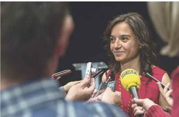
Primeras declaraciones de la ya alcaldesa.

a su familia, a sus padres, y habló de la historia de unos trabajadores que llegaron a Getafe en los años 80 con dos hijos, y que tuvieron la oportunidad de estudiar en la misma ciudad "en la universidad, en una universidad pública y gracias a becas. Ese día aquella pareja supo que el sudor de su frente había merecido la pena. Esa lucha tuvo un final feliz. Esas personas son mis padres. Pero bien podrían ser los padres de cualquiera de esta generación que hoy se abre paso. Hoy tomo posesión como alcaldesa