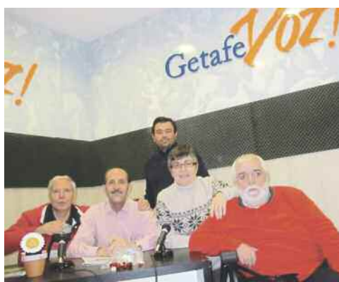
Primer programa. Noviembre 2012.