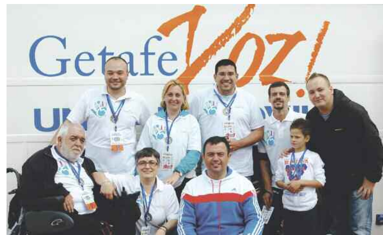
En la carrera por la discapacidad.

A lo largo de estos casi tres años, Getafevoz ha acogido las manifestaciones de buen número de movimientos surgidos de una sociedad castigada por el vendaval de la crisis, los recortes en educación, los desahucios o el drama del paro. Asuntos que han afectado muy gravemente, y de manera silenciosa, a un importante sector