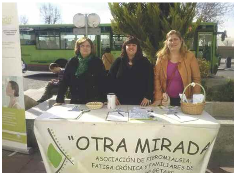
Recogiendo firmas para que sea reconocida como enfermedad crónica.

para junto a su equipo algo especial el 10 de mayo para “conmemorar el día en la plaza del Ayuntamiento desde las 11.00 hasta las 14.00 horas” en un “acto llamado Un globo por cada dolor”. Allí se repartirán globos verdes “que es el color de la fibromialgia” y blancos en los