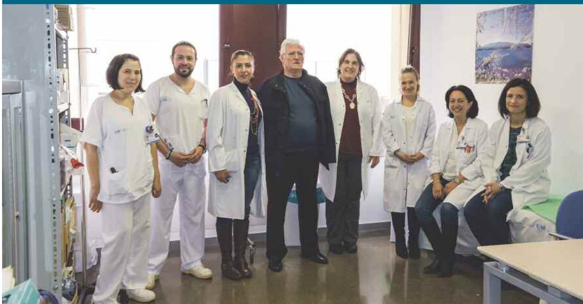
Equipo de la Unidad de Cuidados Paliativos del Hospital de Getafe.