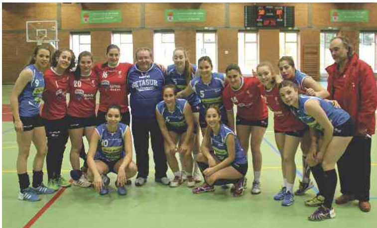
Plantilla del Balonmano Getasur.

Reto conseguido. El Getasur finaliza su temporada en la División de Honor Plata de la Liga de Balonmano en sexta posición tras conseguir la victoria en la última jornada ante el CLEBA León. En total, 17 puntos en la tabla que le han ayudado a mantenerse por delante del Leganés, empatado a puntos con el Getasur, pero por detrás del Chapela, también con los mismos números pero con una mejor diferencia de datos.