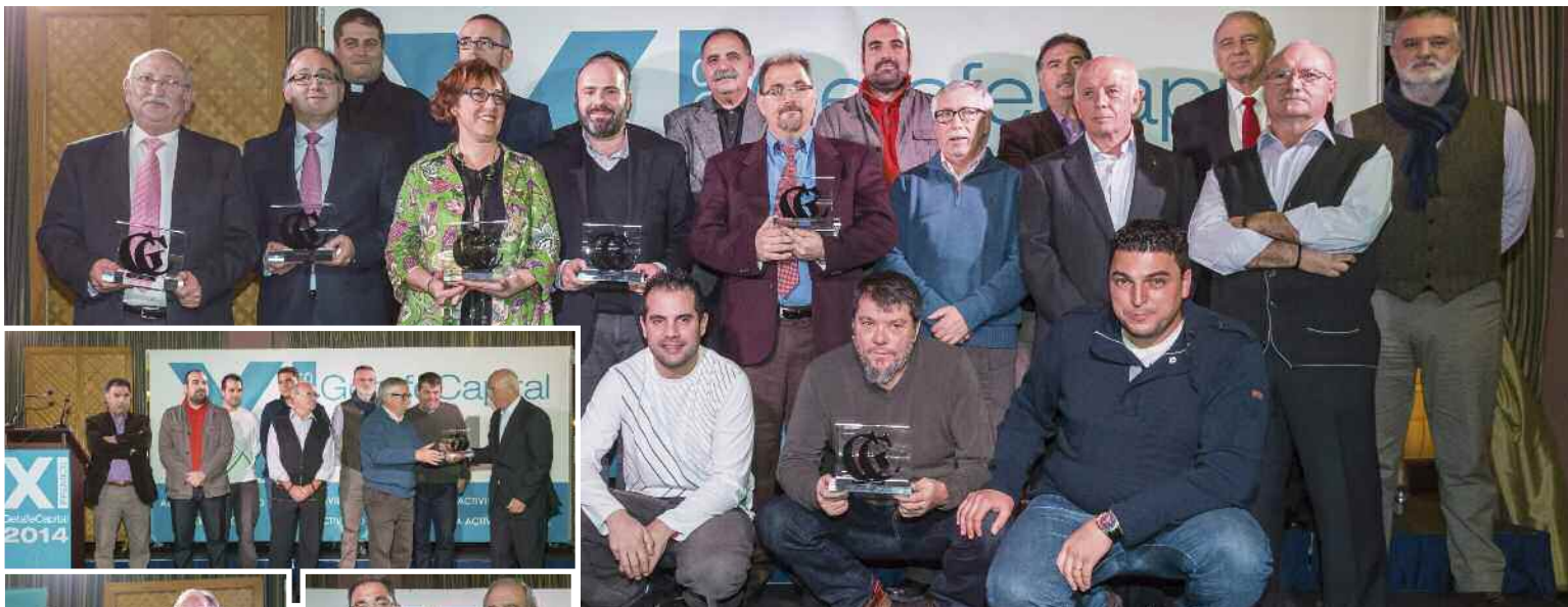
Los 8 de Airbus, el presidente de Iberia, o AFEM, fueron galardonados ante un auditorio repleto.