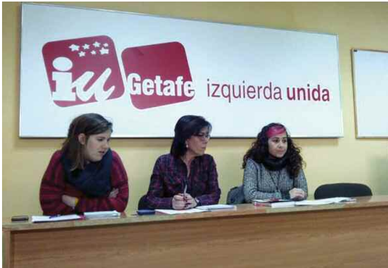
IU presentó el boceto de su programa electoral.

El grupo político Izquierda Unida dejó claro en la presentación del primer borrador de programa electoral que necesitaban a los vecinos de Getafe. A través de un foro en su página web y las redes sociales (#ParaGetafeQueremos), IU espera que el pueblo de la localidad les facilite todas sus ideas y propuestas a lo largo de estas semanas para crear así un proyecto político definitivo de cara a las elecciones de mayo. Además, el partido organizará varias reuniones en enero y febrero en diferentes puntos de Getafe para que los ciudadanos puedan asistir, conocer de primera mano las ideas y bloques en los que se basará su candidatura,