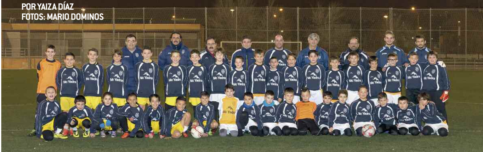
Futbolistas de la plantilla de la Agrupación Deportiva El Norte junto a entrenadores y directivos.