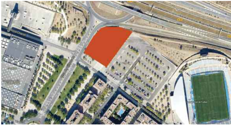
Parcela en la que irá enclavada la gasolinera y el centro comercial.