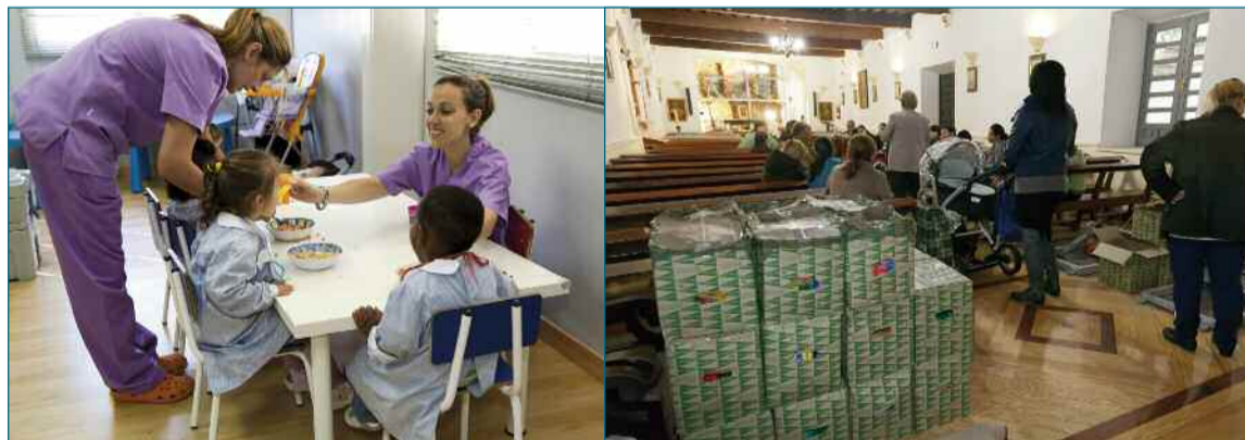
Los niños son uno de los colectivos que más sufren la crisis, mientras el perfil de familias necesitadas ha cambiado en los últimos años.

na a través de todas sus parroquias y la Fundación Hospital de San José reparten hasta varias veces a la semana alimentos para las personas más necesitadas. Leche, aceite, patatas, caldo o incluso alimentos para bebés son solo algunos de los productos que se dispensan desde el popular Hospitalillo de San José. Haciendo gala de su tradición auxiliadora, el edificio acoge a vecinos "de toda clase y nacionalidad" en busca de productos que cubran sus necesidades bási-