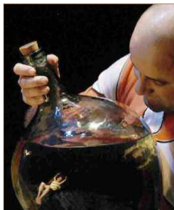
Pezes Teatro García Lorca Domingo, 2 de febrero 12.00 horas

historia que seguir, sino que son pequeñas acciones. Si existe la palabra, hay una voz en off ya grabada de un niño y una mujer, acom-