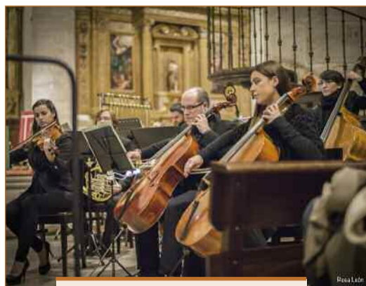
Presentación de la Orquesta Sinfónica Ciudad de Getafe Teatro García Lorca Viernes, 31 de enero, 20.00 horas

Navidad en Getafe", explica el director, "pero este será nuestra presentación como orquesta de manera individual". "Tenemos mucha ilusión", cuenta, "esperamos muy buen ambiente y que la gente responda", añade el director, recordando con emoción los buenos resultados obtenidos, en cuanto a presencia de público, el pasado mes de diciembre en escenarios como el de la Catedral Santa María Magdalena. Sin embargo, desde la propia orquesta saben que no va a ser un camino fácil. "Queremos que la gente observe la versatilidad que ofrece la orquesta", explica, "esta música es algo a lo que la gente está poco acostumbrada, y lo difícil es que la gente venga y pague la entrada".