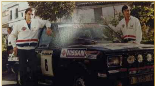
Copiloto y piloto exhibían el coche participante en la plaza de la Constitución.