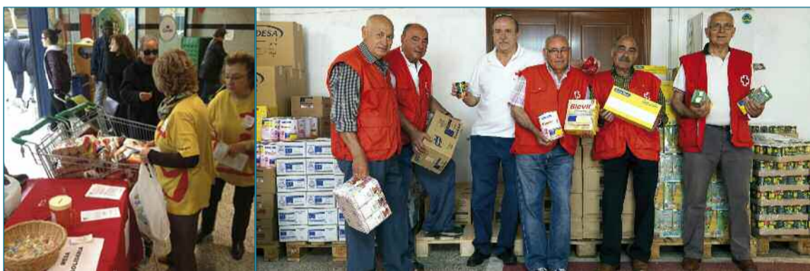
Recogidas de alimentos y colectas ciudadanas ayudan a dotar de recursos a las ONG que ayudan a las personas en riesgo de exclusión.