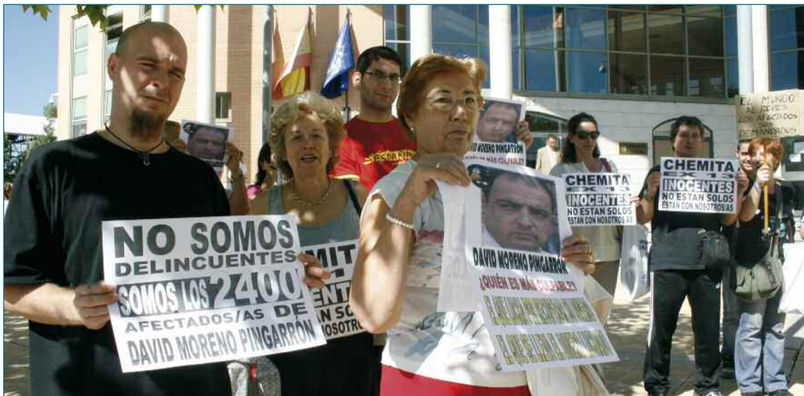
Los cooperativistas de PSG llevan casi una década manifestándose para recuperar su dinero.