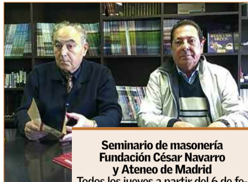
Seminario de masonería Fundación César Navarro y Ateneo de Madrid Todos los jueves a partir del 6 de febrero y hasta el 29 de mayo