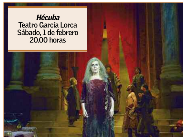
Hécuba Teatro García Lorca Sábado, 1 de febrero 20.00 horas

es ahí cuando sale lo peor del ser humano", contextualiza Plaza. "Ya lo estamos viendo, la gente está empezando a no poder más. Yo, por ejemplo, prefiero el desorden a la injusticia, al revés que Goethe", subraya el director, quien en el estreno de la obra animó a los asistentes a aplaudir menos y tomar las calles para reivindicar sus derechos. A pesar de todo ello, Plaza ha abordado la historia de una venganza evitando que esta sea la idea final de la obra. " Hécuba justifica como el ser humano puede llegar al animalismo, a lo peor de sí mismo. Como las circunstancias marcan un camino que es el equivocado", argumenta, "la clave de la obra está en que esa mujer es capaz de darse cuenta de lo que ha hecho, sim-