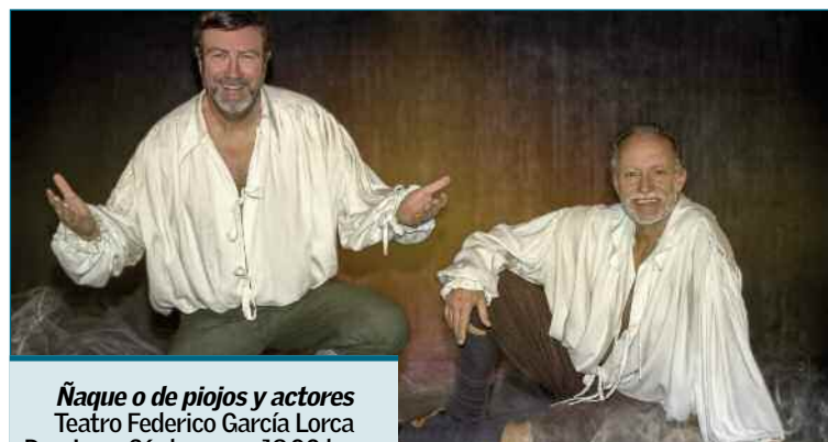
Ñaque o de piojos y actores Teatro Federico García Lorca Domingo, 26 de enero. 19.00 horas

Ambos presumen de haber interpretado junto a los mejores actores de teatro, haber recibido críticas de público y crítica y elevar el "sello Taormina" -la naturalidad y