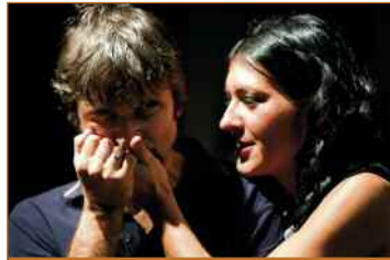
La Muerte y la Doncella MuestraG Teatro García Lorca Sábado, 18 de enero, 20.00 horas

El nuevo año trae consigo la VI edición del festival de teatro MuestraG, dando comienzo así la temporada de representaciones teatrales de Getafe. Esta edición del famoso certamen que tiene lugar en la localidad será mucho más que las actuaciones de las compañías sobre unas tablas. Todos sus participantes, y en especial sus organizadores, dedicarán toda su pasión y esfuerzo a conmemorar las seis temporadas que cumple MuestraG, y lo harán con