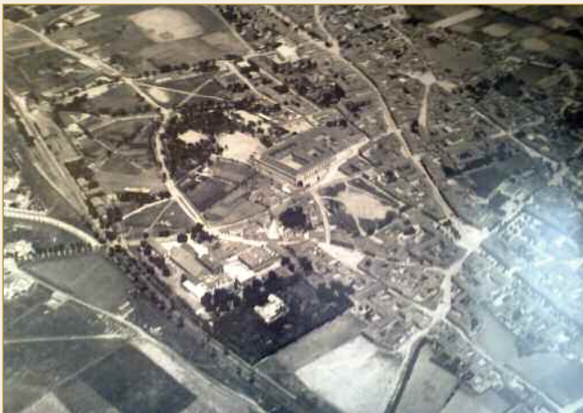
Panorámica aérea de Getafe en 1930. Grupo San Isidro y La Alhóndiga en Facebook

Por extensión y casi por antigüedad, el colegio Padres Escolapios. Prácticamente en el centro de la imagen. Varios edificios de grandes dimensiones agrupados. Solamente superados por el Hospital de San José, que es del siglo