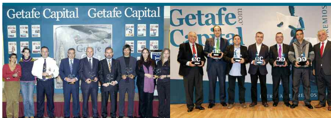
DE LOS PRIMEROS PREMIOS...

asociaciones como Cruz Roja, Casa de Extremadura, Perros de Rescate de Protección Civil, Apanid, Feddig 2008, Asociación de Diabéticos... Ha sido una gran labor la que se ha desarrollado en el municipio y que ha tenido como protagonistas a sus gentes. Las estatuillas han ido cambiando también. Desde la emblemática GC que se ha convertido en símbolo de la publicación, a la bandera que los periodistas clavan en el suelo con el lema Libres de Martín Calderón, pasando por el futurista hombre leyendo el periódico de dEmo.