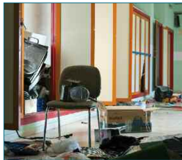
Estado del antiguo colegio Ramón y Cajal.

Como ya denunciaron a mediados de noviembre el PSOE e IU, el antiguo colegio abandonado del Sector III Ramón y Cajal está sufriendo serios destrozos, además de ciertos robos de mobiliario y otros actos de vandalismo. Los