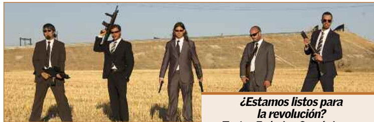
¿Estamos listos para la revolución? Teatro Federico García Lorca Jueves, 28 de noviembre 20,30 horas

música”, cuenta Izquierdo, “el García Lorca es un sitio grande, con la ventaja de que gente más adulta a la que le guste la danza pueda conocer también nuestra música”. Música y danza aparte, la puesta en escena será la gran baza de este espectáculo. “Al final es lo más importante, nosotros iremos vestidos como rockeros que somos y ellos con sus mallas y su vestuario de ballet”, indica el músico. Pura fusión, que no perderá ni un ápice de