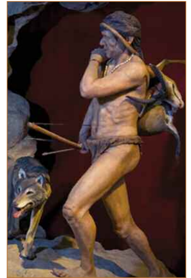
Exposición 'Neolítico. De nómadas a sedentarios' Plaza de España, Carpa de La Obra Social La Caixa Del 27 de noviembre al 13 de enero