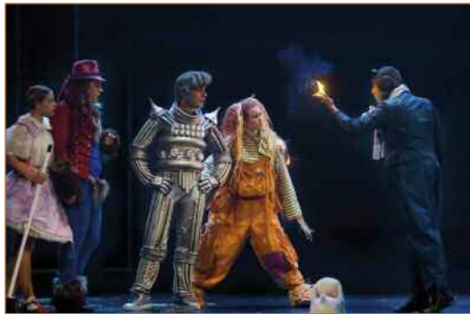
El Maravilloso Mago de Oz Teatro García Lorca Sábado, 8 de diciembre A las 17.00 y 19.00 horas

más pequeños como a sus familias. Y son los más mayores los que se sienten más impresionados al presenciar esta versión de Ricard Reguant, en la que hasta el mismísimo Mago de Oz se convierte en el