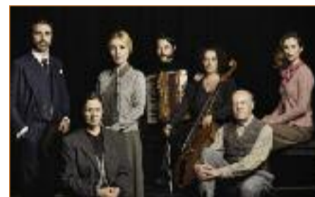
El Malentendido de Albert Camus Teatro García Lorca Domingo, 27 de octubre 19.00 horas

sorpresa por el probable hecho de no haberle reconocido debido al tiempo transcurrido al llegar al alojamiento. Sin embargo, las dos mujeres han dedicado los últimos años de su vida a asesinar a los