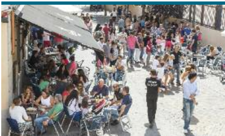
150.000 TAPAS EN TRES DÍAS. Ese es el balance que se hace de la Ruta de la caña que se celebró en el municipio el pasado fin de semana. El buen tiempo ayudó a que los 40 establecimientos participantes pudieran tener un respiro en estos tiempos de crisis.

Tiene una masa social detrás que avala el trabajo que se está desarrollando. "Tenemos 2.494 socios al corriente de pago (2,5 euros al mes) y los menores de 27 años que no pagan serán otros 1.200 o 1.400". No se plantea dar el cerrojazo. Al revés: "Quiero seguir colaborando con este municipio y eso es posible gracias a la gente que trabaja altruistamente para los demás". Seguirá organizando citas tradicionales de degustación de platos tradicionales "a las que, mira que casualidad, no faltan los políticos. No quieren sentarse a hablar de los problemas de la casa, pero sí a comer". Se plantean medidas como recoger firmas para pedir "un Pleno monográfico en el que se hable de las casas regionales y el resto de asociaciones".