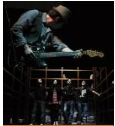
Concierto benéfico a favor de AFEM Teatro Auditorio García Lorca Domingo, 22 de septiembre. 20.00 horas