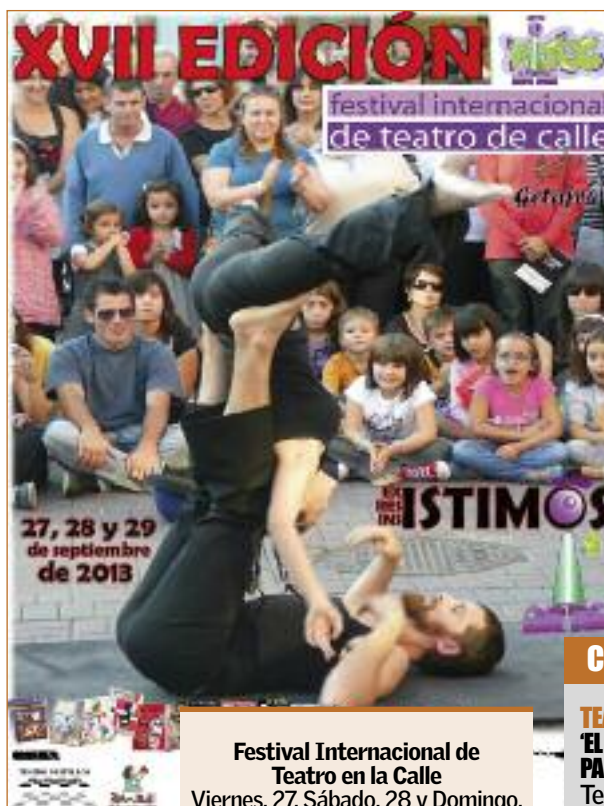
Festival Internacional de Teatro en la Calle Viernes, 27, Sábado, 28 y Domingo, 29 de septiembre Actuaciones en el Hospitalillo de San José, calle Madrid, plaza de la Constitución, plaza General Palacio. Mercadillo medieval en inmediaciones de calle don Fadrique.