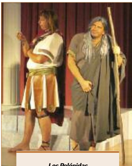
Los Pelópidas Teatro Al Alba - 100% Getafe Teatro García Lorca Sábado 21 de septiembre 20.00 horas

momento más apropiado para hacer esta obra" afirma Garrido, relacionando la trama de la historia con la crisis similar que vive España. "Nosotros metemos nombres de personajes de ahora, de la crisis y la actualidad, en plan cómico" comenta. El propio Garrido afirma que, desde el grupo teatral, no preten-