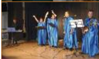
Ritmo en la calle Hospitalillo de San José

Cuarteto de flautas Frullato Flute Ensemble