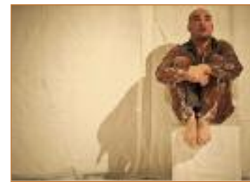
1984 de George Orwell Teatro Federico García Lorca Sábado, 14 de septiembre. 20.00 horas

1984 será la primera obra que estrena Dodecaedro Ars como compañía teatral. Esta plataforma, que promociona las artes plásticas, conjuga cine, pintura, escultura, teatro o literatura, “tantas facetas como caras tiene un dodecaedro, de ahí su nombre”- lleva poco más de un año en funcionamiento.