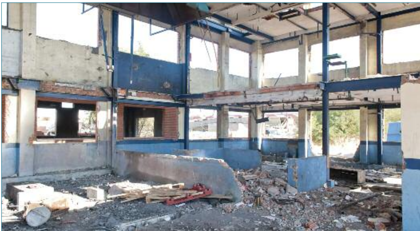
Interior de uno de los edificios que aún se mantiene en pie / Mario Dominos