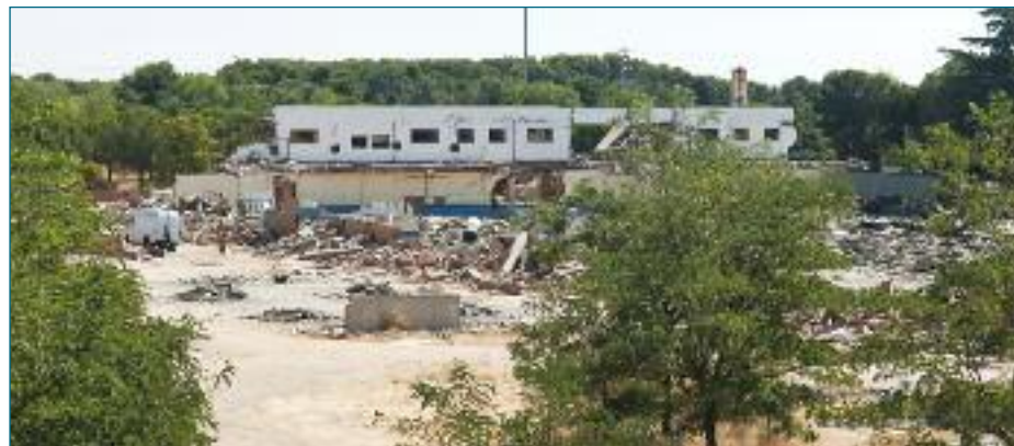
Decenas de furgonetas han 'limpiado' el terreno durante tres semanas

Las diez naves que constituían el edificio de NB Cojinetes de Fricción han pasado a la historia. Con el calor estival, en pleno agosto, los sorprendidos vecinos que rodean esta fábrica abandonada comenzaron a ver decenas de furgonetas que invadían el terreno y empezaban una sistemática destrucción de las naves para recoger todo el material que pudiera ser de utilidad en el mercado: metales, cables, hierro, ventanas... Nada escapó a la habilidad de estos 'chatarros' que invadieron