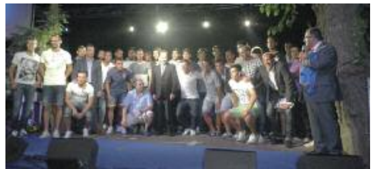
Plantilla del Getafe CF durante la celebración

ya jugó cedido en el club de Getafe desde enero de la pasada temporada y que llega al club azulón por cerca de 500.000 euros. Además ya se conoce cuál será el calendario del décimo año en Liga para el Getafe. El equipo de Luis García iniciará su temporada en Anoeta ante la Real Sociedad, mientras que el Almería, recién ascendido de segunda división, será el primer visitante que recibirá el Coliseum Alfonso Pérez.