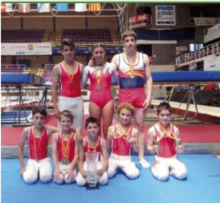
Miembros del Club Gimnástico Getafe en el pasado Campeonato de España