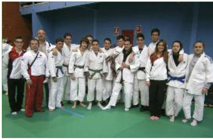
Alumnos del Gimnasio Manuel Jiménez / Gimnasio Manuel Jiménez

Son momentos difíciles para nuestra sociedad. Vender Getafe implica apoyar actividades importantes. Y el deporte lo es. Podría suceder que una parte de nuestro deporte desapareciera por desidia oficial, y que algunos equipos se vieran obligados a trasladarse a otras ciudades vecinas por problemas económicos. En ese caso, no estaríamos vendiendo Getafe. Estaríamos liquidando una parte de nuestro patrimonio.