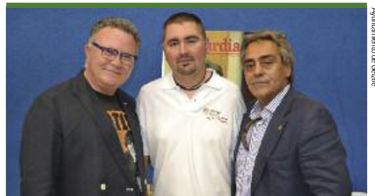
Ayuntamiento de Getafe

Desde el Gimnasio Manuel Jiménez confían en que la experiencia, las costumbres y el trato que tan buenos resultados han dado en el pasado se van a seguir siendo una pieza clave para el futuro de sus deportistas.