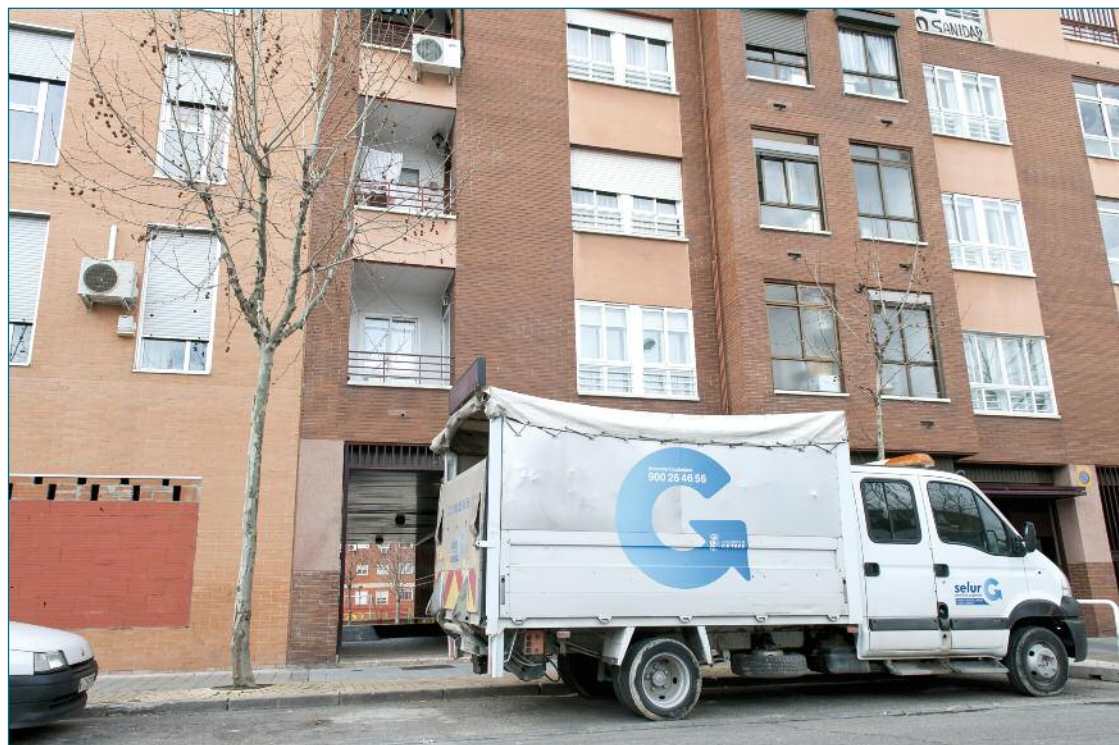
El camión de LYMA a las puertas del edificio