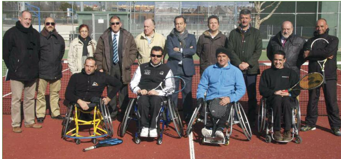
Los primeros cuatro alumnos de la escuela posan con los técnicos municipales y los representantes de las entidades colaboradoras en el Juan de la Cierva

adaptar "más allá de la silla, la altura de la red, las normas, las penalizaciones... excepto que pueden dejar botar dos veces la pelota", relata el presidente. "Lo bueno de este deporte es que se juega por la normalización. El tenis es un deporte más difícil, más técnico, pero por ejemplo, en el pádel, se puede compaginar el juego de personas con y sin discapacidad perfectamente". Los alumnos de esta recién creada escuela tienen además, una ventaja añadida importante, según Rodríguez, "todos tienen un gran manejo de silla, que no les hemos tenido que enseñar a usar de cara a la práctica del deporte. Existe un caso, de hecho, que no precisa silla de ruedas para moverse, pero juega a un gran nivel sentado". El agradecimiento y la buena acogida de la escuela se percibe en cada una de las