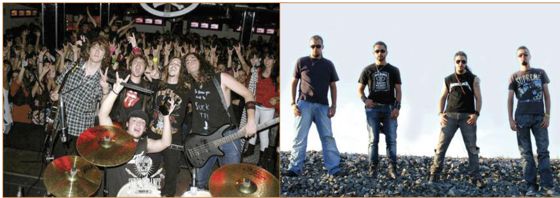
Hollywood Twist (izquierda) y Leyenda Involuntaria (derecha) será dos de los cuatro grupos que actúan mañana en la Old School.

grupos”. Ahora, se muestran “realistas, pero ojalá pegáramos el pelotazo, de todas formas seguiremos currando como hasta ahora.