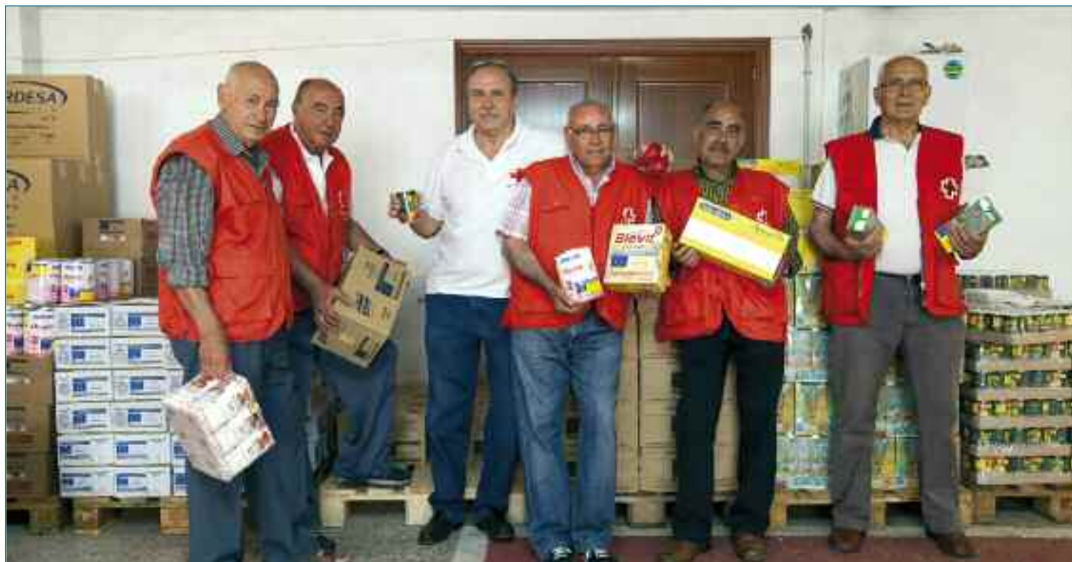
Los seis voluntarios de Cruz Roja que realizan su labor solidaria, sin nada a cambio, en el almacén de alimentos de la ONG.