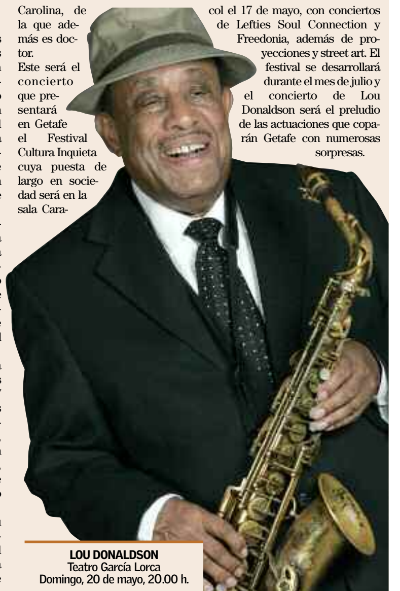
LOU DONALDSON Teatro García Lorca Domingo, 20 de mayo, 20.00 h.

col el 17 de mayo, con conciertos de Lefties Soul Connection y Freedonia, además de proyecciones y street art. El festival se desarrollará durante el mes de julio y el concierto de Lou Donaldson será el prelude de las actuaciones que coparán Getafe con numerosas sorpresas.