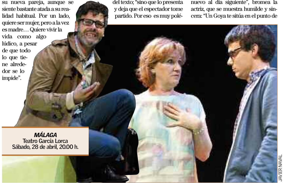
MÁLAGA Teatro García Lorca Sábado, 28 de abril, 20,00 h.