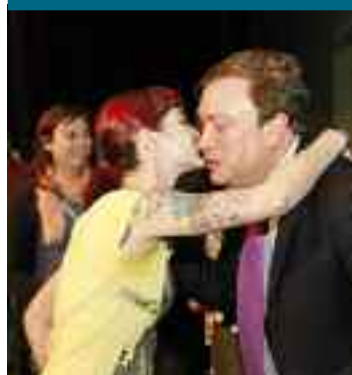
340 FAMILIAS MÁS TIENEN PISO EN LOS MOLINOS Y BUENAVISTA. La Empresa Municipal del Suelo y la Vivienda (EMSV) ha hecho entrega de las llaves de 183 viviendas de protección pública básica en Buenavista (parcela B9) y 158 de protección limitada en Los Molinos (parcela A17). La entrega de estas promociones ha tenido lugar en el Teatro García Lorca.

APROVECHA LAS DESGRAVACIONES Compra tu nueva vivienda antes del 31 de diciembre