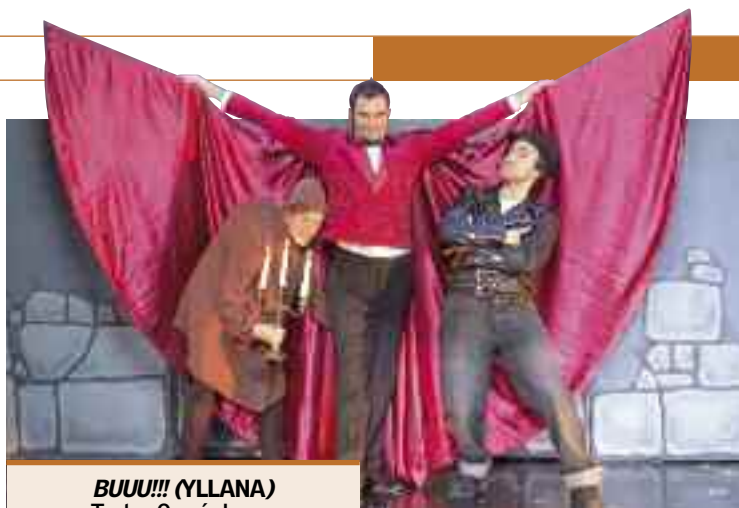
BUUU!!! (YLLANA) Teatro García Lorca Domingo, 29 de abril, 19.00 h.

amada Igorina, que antes era una bailarina con la que hacía sus espectáculos. Sin embargo, la magia les juega una mala pasada, y ella queda convertida en jorobada". Hernández no quiere desvelar mucho más para que los espectadores se sorprendan y diviertan al máximo, se dejen llevar, en definitiva, por el humor de Yllana.