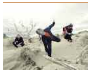
ASTRIO Fender Club Jueves, 26 de abril, 22.00 h.

¿Cómo definiríais Don't leave the planet ? “Es un álbum con doce temas, todos ellos con diferentes estilos y aires”, explica Smith. “Dos tienen la particularidad de contar con voz, a pesar de que somos un grupo instrumental”. ¿Y a qué suena? ¿Qué influencias se puede decir que tiene Astrio? “Hay canciones que pueden recordar desde Radiohead y Coldplay a cosas más de música psicodélica de los setenta, electrónica de baile, o más rockera”. El grupo cita Deep Purple, Jimi Hendrix, Metallica, Soulive, Grant Green, Justice o Jazzanova como algunos de los principales grupos que suelen escuchar y que les sirven como referente artístico para crear. Sus dos trabajos anteriores son As soon as possible (2004) y Desplazamiento (2007), y a las composiciones de ambos se suman las de su nuevo álbum, a las que darán prioridad en su concierto en Fender