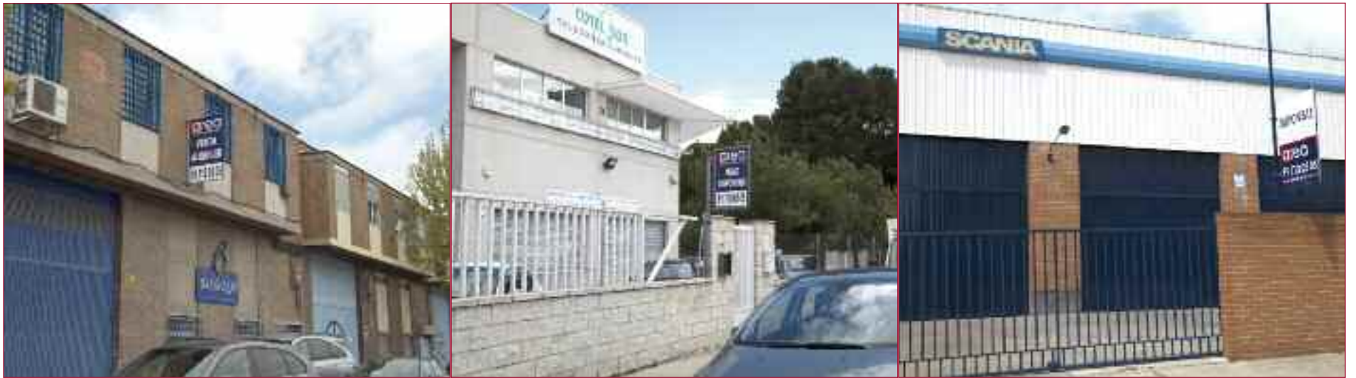
Naves disponibles, en este caso de Area Asesores Inmobiliarios, en los polígonos de Los Ángeles, Los Olivos y San Marcos.

Las naves disponibles aumentan y la demanda está estancada, aún así, Getafe está entre los municipios más solicitados