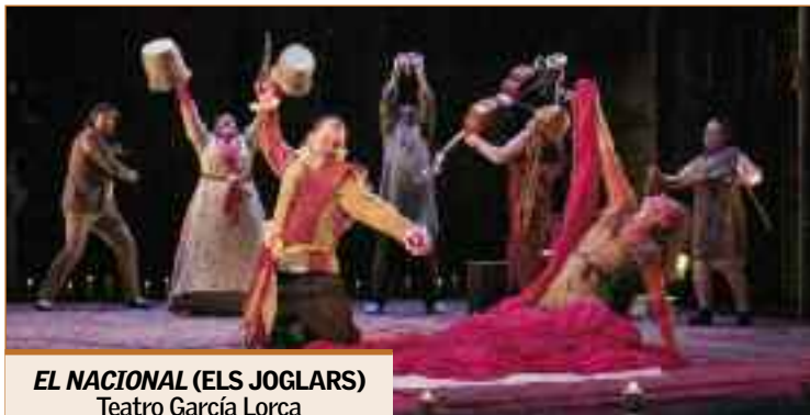
EL NACIONAL (ELS JOGLARS) Teatro García Lorca Sábado, 21 de abril, 20,00 h.

nista de la obra El Nacional , un montaje que la compañía llevó a las tablas por primera vez en 1993 y que ahora vuelve a los escenarios. ¿Y a qué se refiere Fontseré? ¿Sobre qué querían hacer reflexionar Els Joglars? Hace falta remontarse a 1993. Él mismo lo explica: " El Nacional es el producto de un tiempo post-olímpico, tras Barcelona '92. Entonces hubo un amago de crisis, que nos pareció que contrastaba bastante con los grandes despilfarros de dinero que se hacían en el teatro. Decidimos hacer un espectáculo sobre ello, sobre el teatro que se hace para colosales construcciones y edificios faraónicos, cuando