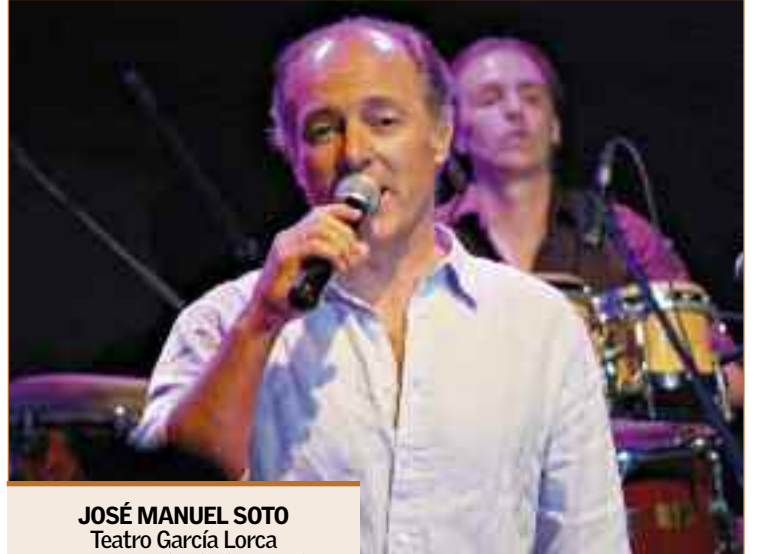
JOSÉ MANUEL SOTO Teatro García Lorca Viernes, 13 de abril, 21.00 h.

Sobre el concierto del día 13 en el municipio, adelanta: "Llevo una banda de seis músicos: batería, bajo, guitarra, piano y percusión. Es un espectáculo de corte clásico: es un tío que sale allí y canta", bromea, entre risas, pero corrige: "No, es más que eso: intentamos que la gente participe, que lo pasen bien. Eso sí, el que espere un espectáculo muy innovador y rompedor, no lo va a encontrar". Para celebrar el cuarto de siglo que lleva encima de los escenarios, el año pasado grabó un disco en directo, Soto & Amigos . El álbum recoge el multitudinario concierto que el artista ofreció en junio en La Maestranza de Sevilla acompañado de multitud de amigos y compañeros de profesión. Él recuerda así la experiencia: "Surgió la idea de hacer un disco en directo porque yo tenía 18 ya grabados y ninguno había sido en vivo. Me acompañaron allí José Mercé, Estrella Morente, Pasión Vega, Lolita Flores, Rosario, Antonio Carmona... Como había tantos amigos allí dije: "esto hay que grabarlo", y del tirón lo hicimos.