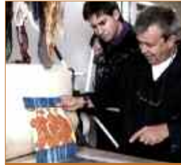
GRABA2 (BIANCHI Y DANIELEM) Sala Lorenzo Vaquero Del 13 al 17 de abril

"Mostraremos por lo menos unas cuarenta obras", asegura Danielelem, quien confiesa además llevar casi un año preparando esta exposición. "Trabajando una media de 4 ó 5