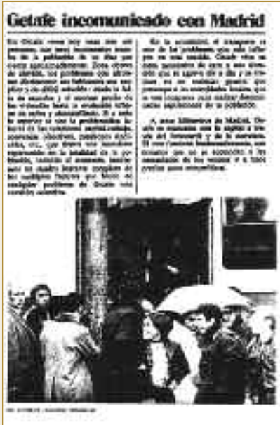
Imágenes de Resistencia política y conflictividad social. Getafe 1939/76.

mientras que la policía detenía a los líderes más destacados". Empresas como Siemens, Kelvinator o John Deere se solidarizaron con ellos. Estos fueron los acontecimientos previos, descritos en el libro Resistencia política y conflictividad social , a la huelga general que se produjo en otoño-invierno de 1975-76. A ello, había que su-