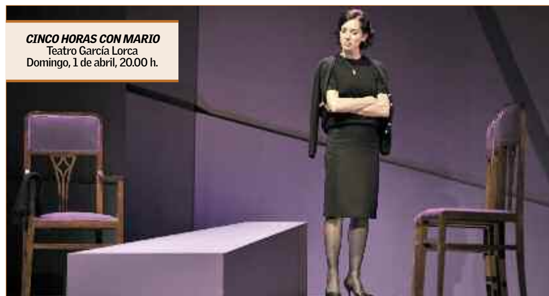
CINCO HORAS CON MARIO Teatro García Lorca Domingo, 1 de abril, 20.00 h.

"Algunos, antes de ver la obra, piensan que es seria, triste, densa..., pero no es así: se trata de una historia apasionante. El sentir general que yo recibo de la gente, tras la hora y media que son nuestras Cinco horas con Mario , es que se les ha pasado en un momento, lo han pasado muy bien", afirma la artista, y reflexiona: "la obra de teatro ilustra muchos matices que las generaciones más jóvenes tal vez no podrían leer entre líneas en el texto escrito. Todos los que nos han visto, también de colegios e institutos, se han divertido mucho: ¡tenías que haber oído sus reacciones, sus risas!", comenta emocionada. "Invito a todo el mundo a venir a ver Cinco horas con Mario ", concluye, y añade: "aceptar este papel ha sido una de las decisiones más acertadas que he tomado en mi vida profesional".