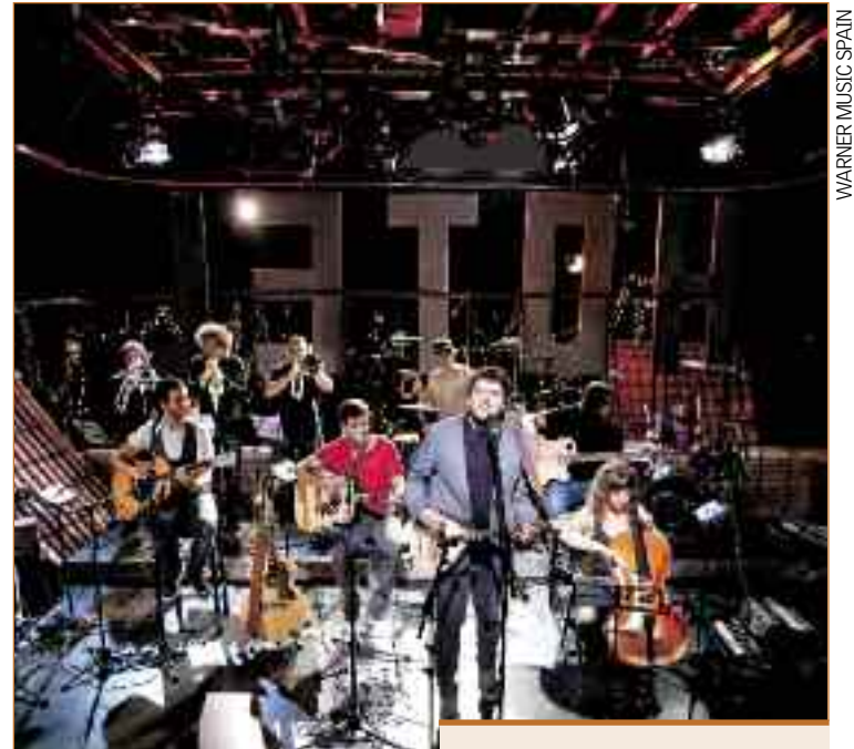
WARNER MUSIC SPAIN

que matiza la razón de su presencia. "No queríamos hacer lo típico que hay ahora tipo un disco de duetos: queríamos hacer al revés, un disco de Despistaos, con nuestras propias canciones, tocadas como nos diera la gana, con más instrumentos, pero que las colaboraciones no fueran ni un reclamo, ni la excusa para hacer el disco, sino simplemente colabora-