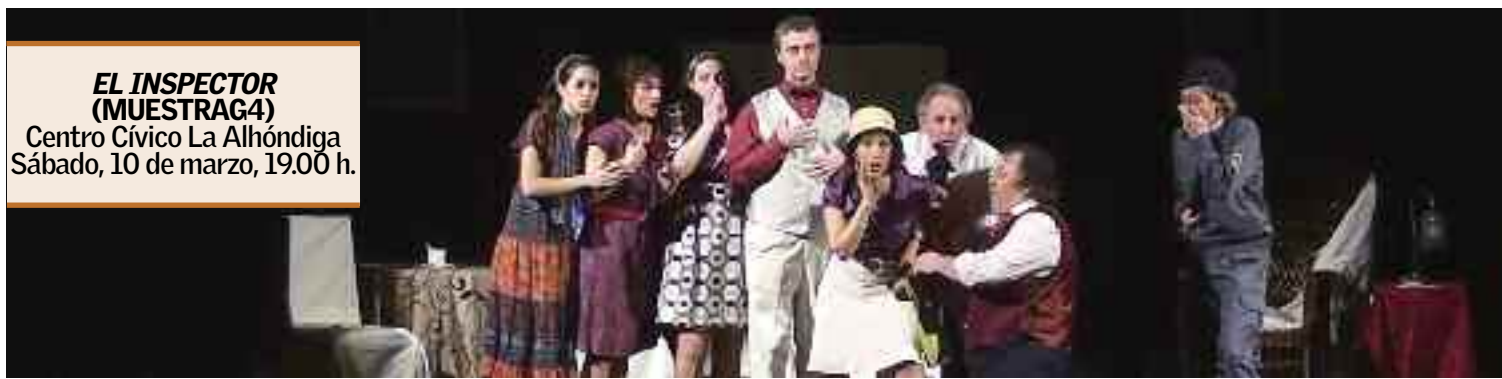
EL INSPECTOR (MUESTRAG4) Centro Cívico La Alhóndiga Sábado, 10 de marzo, 19.00 h.