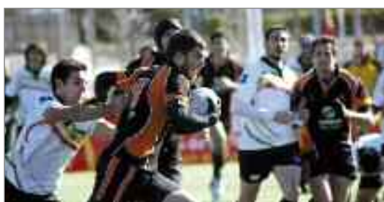
El equipo de rugby Airbus Aeronáuticos avanza imparable hacia la Copa de Madrid.

En resumen, una primera parte de vértigo, donde la delantera aeronáutica estuvo inmensa. Dominio absoluto de las fases de conquista. La melé: parecía deslizar sobre hielo pulido. La Touch; territorio vedado para el dragón. En el juego abierto, claro dominio de Hortaleza, de ritmo feroz a base de llamaradas.