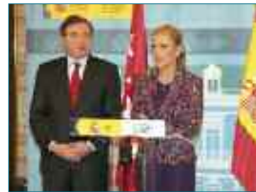
Ayuntamiento de Getafe

El lunes, 6 de febrero, el alcalde, Juan Soler, invitó a la delegada del Gobierno, Cristina Cifuentes, a presidir las Juntas Locales de Seguridad que se celebran en el municipio. La iniciativa tuvo lugar con el objetivo de mejorar la coordinación con el Gobierno de la nación en esta materia y aunar esfuerzos, y se llevó a cabo tras la reunión mantenida anteriormente con Cifuentes en la Delegación del Gobierno en Madrid. Juan Soler es el primer alcalde que se reúne con la nueva delegada y con ella trató diversos asuntos en torno al tema común de la seguridad del municipio, acerca del cual el alcalde afirmó que es una de las prioridades de su Gobierno. Dicho carácter prioritario se manifestaría en el esfuerzo que actualmente realiza para cubrir las vacantes de la Policía Local, o en el reciente anuncio de la constitución en el Cuerpo Local de la Escala Municipal con el