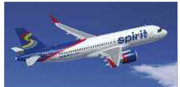
"Spirit tendrá una flota de aviones Airbus casi tres veces mayor a la actual cuando concluyan las entregas de este último pedido", señaló John Leahy

Spirit Airlines ha formalizado el pedido para la adquisición de 75 aviones de pasillo único que incluye 45 A320neo (new engine option – nueva opción de motor) tras el Acuerdo de Intenciones (MoU) firmado durante el Salón Aeronáutico de Dubai 2011. La aerolínea todavía no ha anunciado la elección del motor. Con la formalización de la compra de 45 A320neo en diciembre de 2011 y 30 A320 el pasado mes de enero, el número total de aviones encargados por Spirit asciende a 75 unidades.