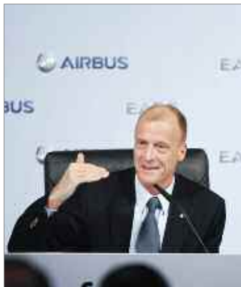
Tom Enders, CEO de Airbus, comunicando los resultados durante la Conferencia Anual de Prensa 2011 en Hamburgo.

Asimismo, EADS ha seguido avanzando con dinamismo por la senda de la innovación. A lo largo de 2011, el A320neo puso de manifiesto la capacidad de Airbus de hacer avanzar tecnológicamente un producto ya maduro con objeto de satisfacer requisitos urgentes del mercado. Eurocopter hizo público su nuevo EC145 T2, logró plusmarcas de velocidad con el X3, comenzó los vuelos de prueba de un demostrador de helicóptero híbrido basado en la plataforma AS350 y lanzó el programa X4. En el sector del espacio, la Agencia Espacial Europea contrató a Astrium para diseñar, suministrar y encargarse de las