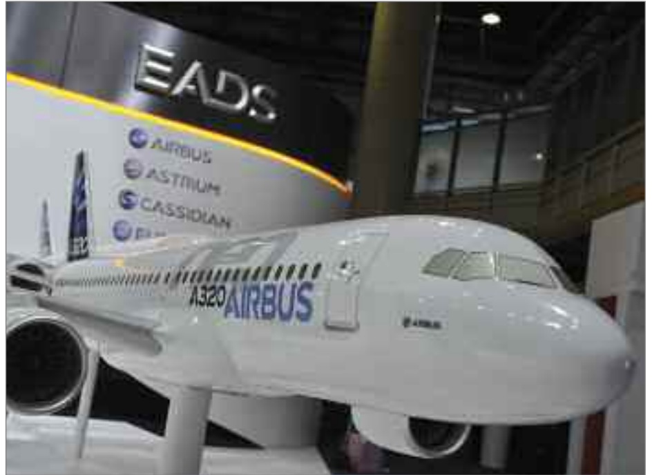
A320neo sobresale como el avión comercial más rápidamente vendido de la historia

La cartera neta de pedidos de aviones comerciales incluye: 19 A380; 52 aviones de las familias A330 y A350 XWB; y 1.348 aviones de la Familia A320. De estos últimos, el A320neo alcanzó las 1.226 órdenes en firme, confirmando su título como "el avión más rápidamente vendido de la historia". En total, la cartera de pedidos asciende a 4.437 aviones, valorados en más de 588.000 millones de dólares a precios de catálogo —el equivalente a 7-8 años de producción. La cartera de pedidos de aviones militares se sitúa en 222 unidades, e incluye: 174 A400M; 22 A330 MRTT; 18 aviones ligeros y medianos; y la conversión de ocho aviones P-3.