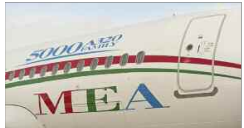
Airbus entrega el A320 MSN5000 a Middle East Airlines.

Importante logro en la producción de la moderna familia de pasillo único