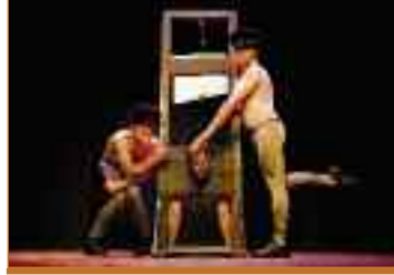
666, de Yllana Teatro García Lorca Domingo, 5 de febrero, 20.00 h.