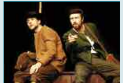
A LA ACTIVIDAD CULTURAL Taormina