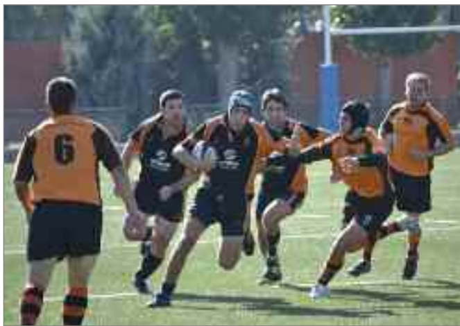
Airbus Aeronáuticos no ha podido comenzar de mejor manera la liga con todos los partidos ganados.

Airbus gana al Getafe B en la segunda jornada de la liga, lo que lo mantiene como líder de la clasificación. El resultado final: Airbus Aeronáuticos 64-7 Getafe B.