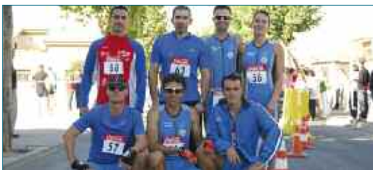
Los siete integrantes del equipo de duatlón de la Policía Local de Getafe.

Es una obra menor que correrá a cargo de los alumnos de la ALEF, la Agencia Local de Empleo y Formación. El Hospitalillo de San José acometerá de esta forma un lavado de cara de las partes más visibles, esto es, el patio interior, que mejorará el suelo de piedras para que sea más cómodo y se dará una mano de yeso y pintura en los espacios que ya notan la huella del tiempo. Las obras podrían estar finalizadas a mediados de noviembre.