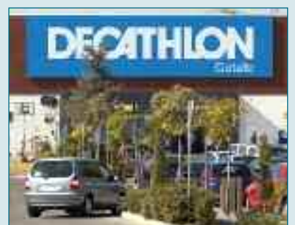
A LA EMPRESA DEL AÑO Decathlon