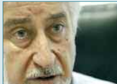
AL DESARROLLO DE UN PROYECTO INNOVADOR Elecmegom