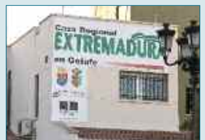
A LA ACTIVIDAD SOCIAL Casa de Extremadura