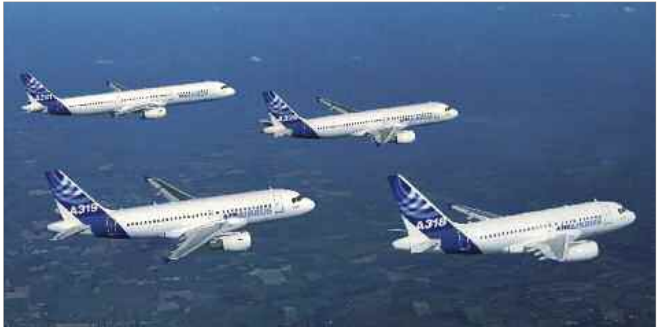
La mayor demanda de aviones en Rusia será para los aviones de pasillo único, con un incremento estimado en 839 unidades.

Hoy, nueve aerolíneas rusas operan alrededor de 170 aviones Airbus y más de 80 aparatos tienen prevista su entrega en los próximos cuatro años. Christopher Buckley, vicepresidente ejecutivo de Airbus para Europa, Asia y el Pacífico, señaló que este año se han sumado tres nuevos operadores que utilizan aviones Airbus en Rusia y que confía en lograr dos o tres más hasta finales de 2011.