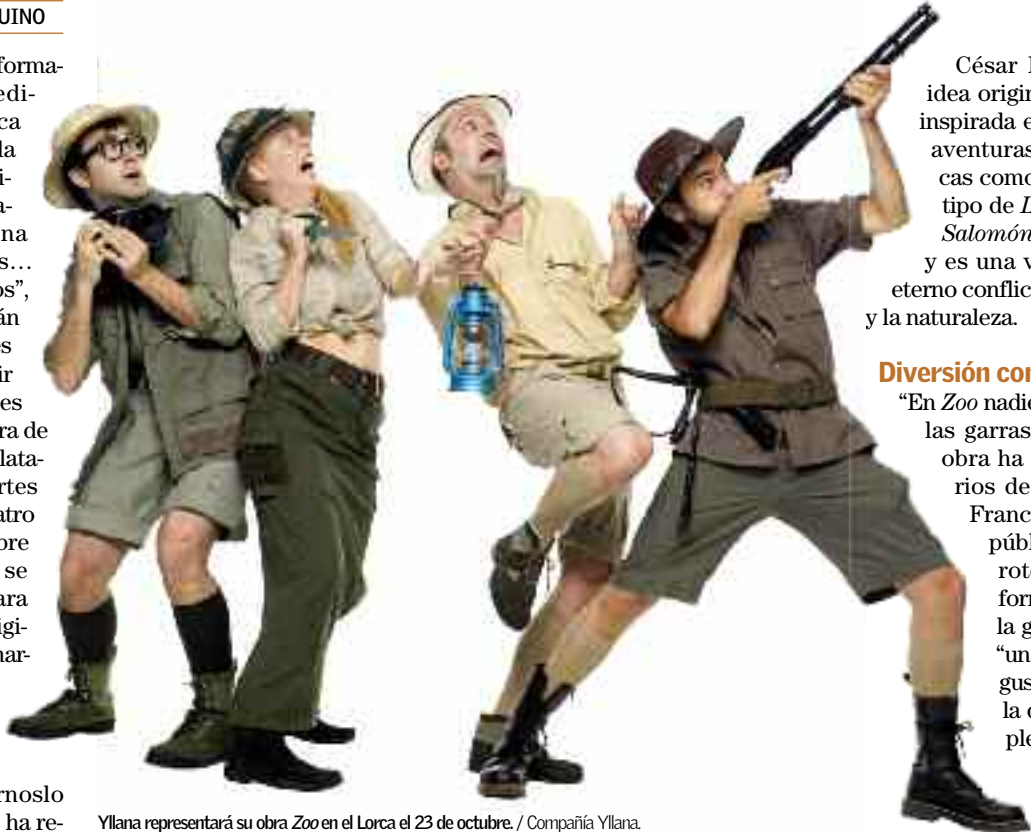
Yllana representará su obra Zoo en el Lorca el 23 de octubre.