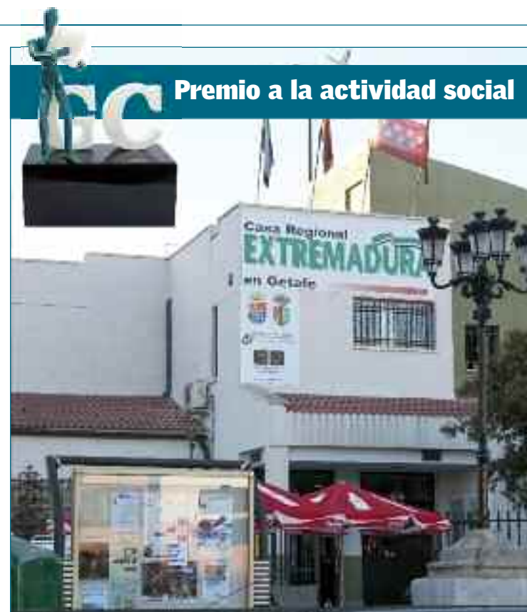
Premio a la actividad social

Pero si hay una actividad multitudinaria que cada año supera sus propios registros es la feria ARTE de Extremadura, por la que pasan anualmente hasta 30.000 personas, conociendo de primera mano las delicias gastronómicas de la región, su artesanía o sus espacios naturales y turísticos. En 2012, esta cita ya asentada cumplirá su vigésimo aniversario. No se pierden tampoco las citas importantes del municipio: las fiestas de Getafe, la Feria del Libro o los Carnavales, en las que partici-