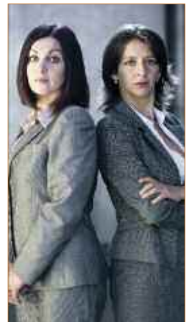
CARALLADA SHOW / PREM TEATRO

El domingo, 30 de octubre, a las 20.00 horas, se celebrará la entrega de premios en el Teatro García Lorca.