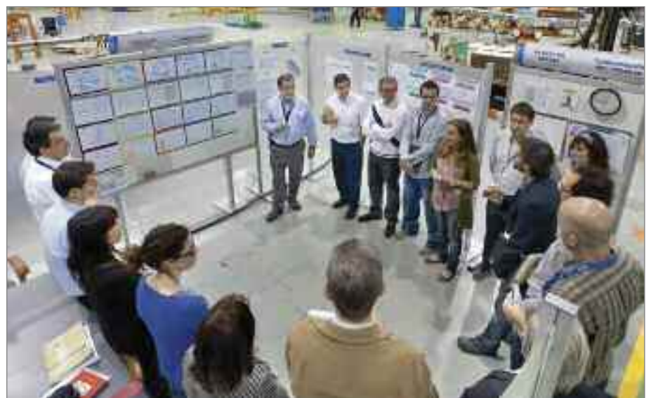
Un ejemplo de la similitud entre "La Asamblea" en el colegio y la reunión diaria de nivel 4 en la fábrica.

El colegio de educación infantil y primaria Teresa Berganza, en Boadilla del Monte (Madrid), ha trasladado a su día a día la filosofía Lean como herramienta en su trabajo con los más pequeños. El centro educativo utiliza una detallada tabla de tareas que se repite diariamente. A primera hora de la mañana comienza lo que ellos denominan "La Asamblea", donde los niños cuentan a sus compañeros y profesores lo ocurrido el día anterior y comparten experiencias. Los maestros aprovechan, a su vez, para explicarles las actividades que van a realizar en su jornada escolar, dando así comienzo a un nuevo día en el cole. También en "La Asamblea", el encargado de la clase