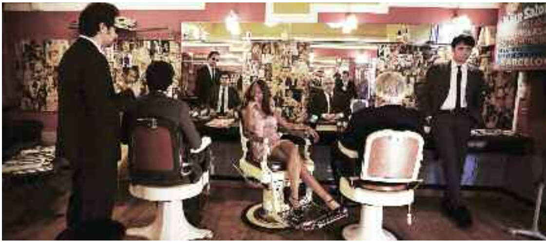
The Excitements, el sábado 16 en Cultura Inquieta.