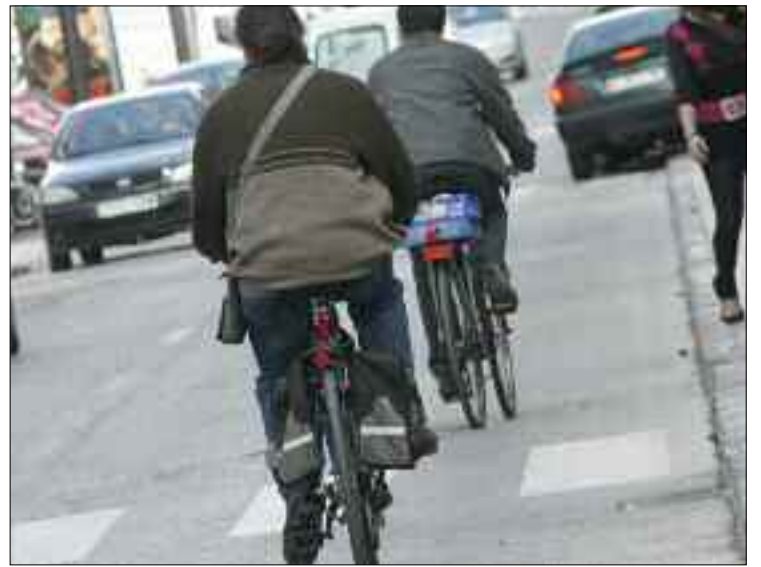
El colectivo Getafenbici defiende las bicicleta como medio de transporte pero considerándola un vehículo más, que pueda circular por las calzadas en compañía de los coches; para eso hace falta formación y concienciación.