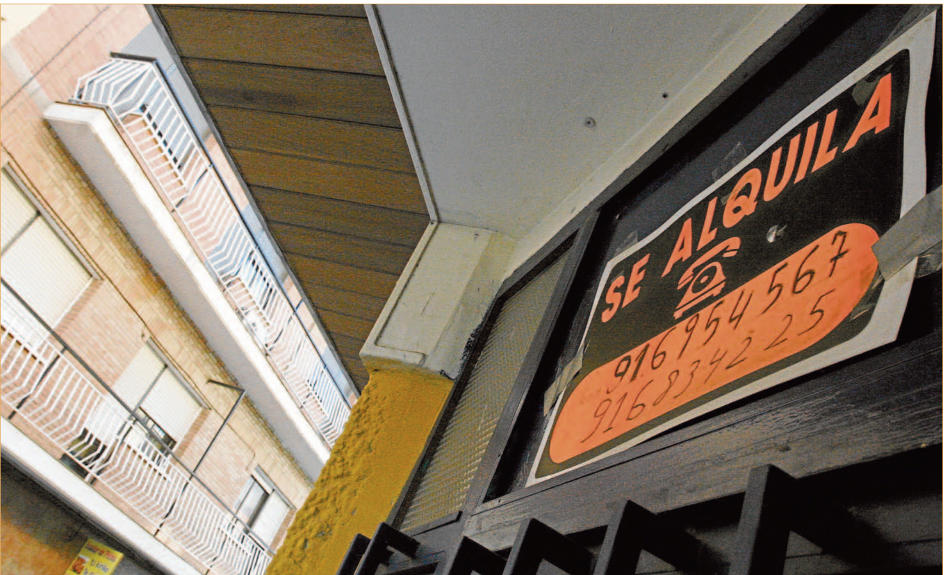
La EMSV hace de intermediaria entre propietarios e inquilinos en alquileres que no superen los 600 euros.