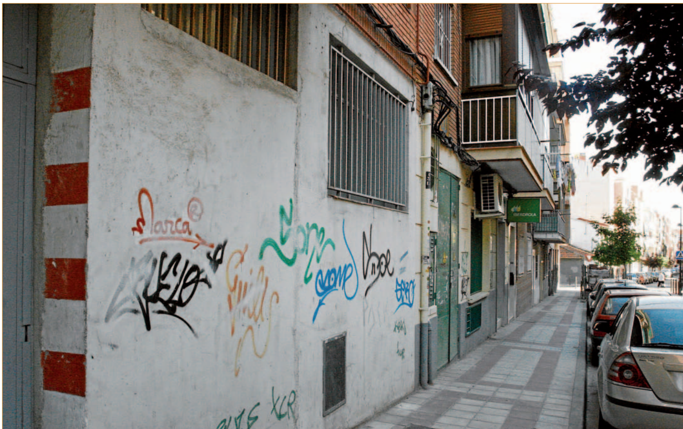
La rehabilitación de barrios antiguos será una de las iniciativas más destacadas de cara a los próximos años. / David Calle

Los viejas viviendas tendrán nuevas fachadas, ascensores y vitrocerámica