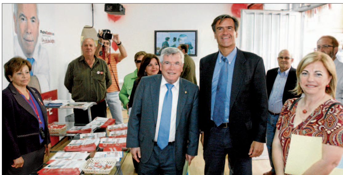
El eurodiputado Juan Fernando López Aguilar, en la inauguración de la oficina del candidato socialista.