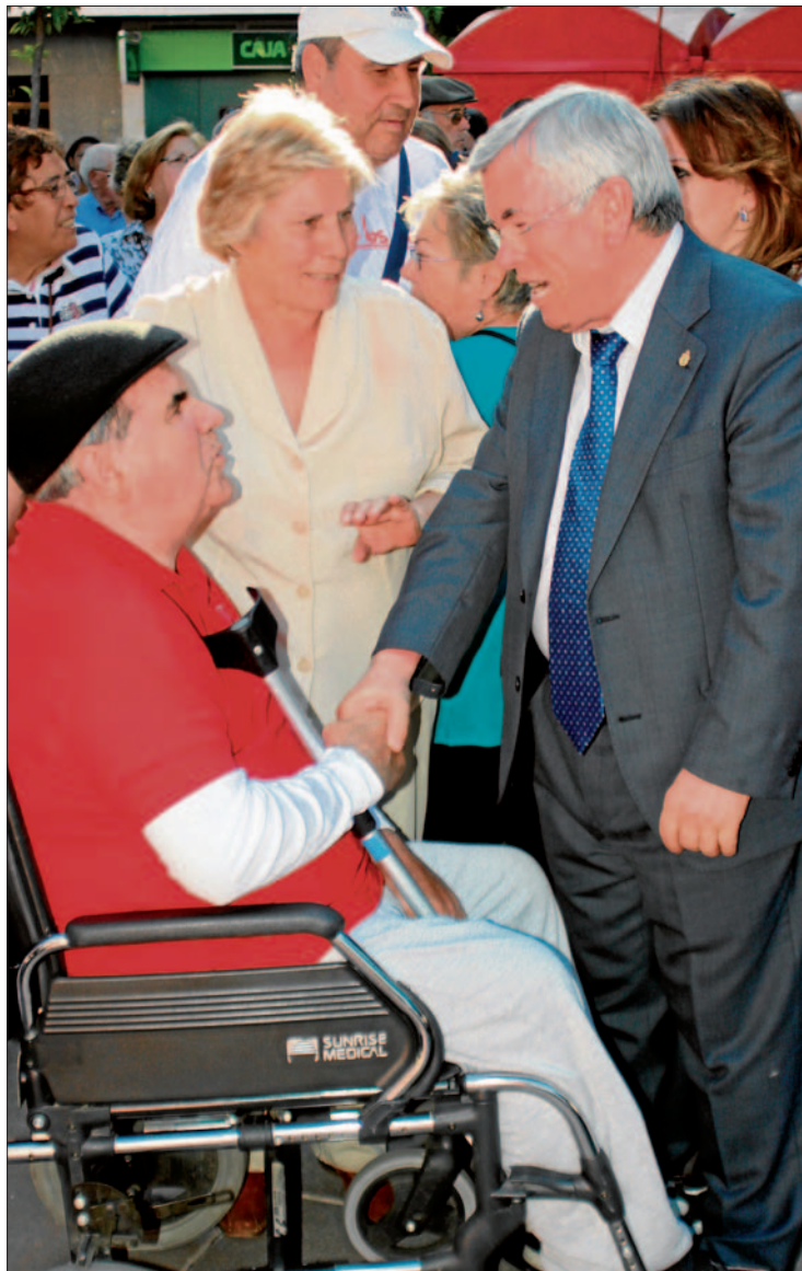
El PSOE destaca la ayuda a los dependientes en su programa.

El desarrollo económico abarca las propuestas sobre reactivación económica, empleo, comercio y turismo. El plan Getafe Trabaja, que contempla la ejecución de pequeñas obras y la actuación con los desempleados que tienen una alta cualificación en sectores como el cultural, es uno de los principales planes que abordan el problema del empleo, al igual que la creación de una bolsa de empleo juvenil. La formación de los parados y las medidas específicas para las mujeres completan la atención directa al desempleado, al que también se pretende favorecer mediante el apoyo a los emprendedores, el desarrollo de 5.000.000 m 2 de suelo industrial que favorezca la llegada de nuevas empresas al municipio o la modernización de las galerías comerciales. En cuanto