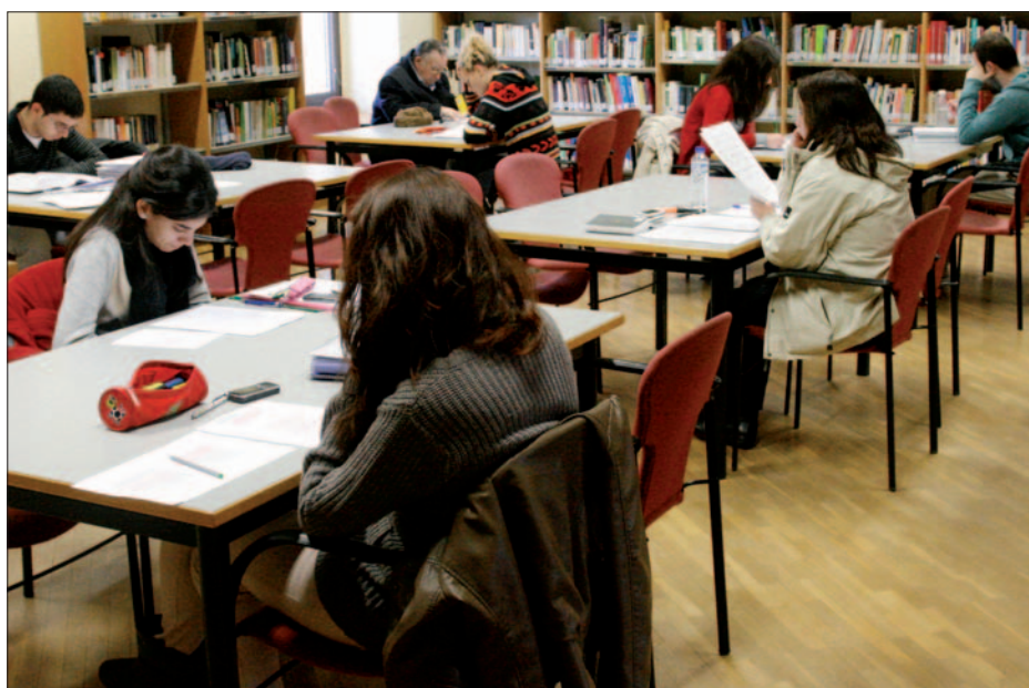
Estudiantes y usuarios habituales coinciden en la biblioteca Ricardo de la Vega.

Torres puntualiza que las bibliotecas públicas son mucho más que simples salas de estudio (también conocidas como estudiantescas) y sus servicios van más allá de procurar un espacio silencioso a los universitarios, una minoría entre sus usuarios. Entre los bibliotecarios, hay quienes argumentan que la Ley de lectura, del libro y las bibliotecas (Ley 10/2007 de 22 de junio) no recoge entre los servicios básicos de estos centros el de ofrecer un ambiente propicio para el estudio. Sus obligaciones están más relacionadas con la difusión de la información y el conocimiento, y el desarrollo de actividades culturales y de entretenimiento.