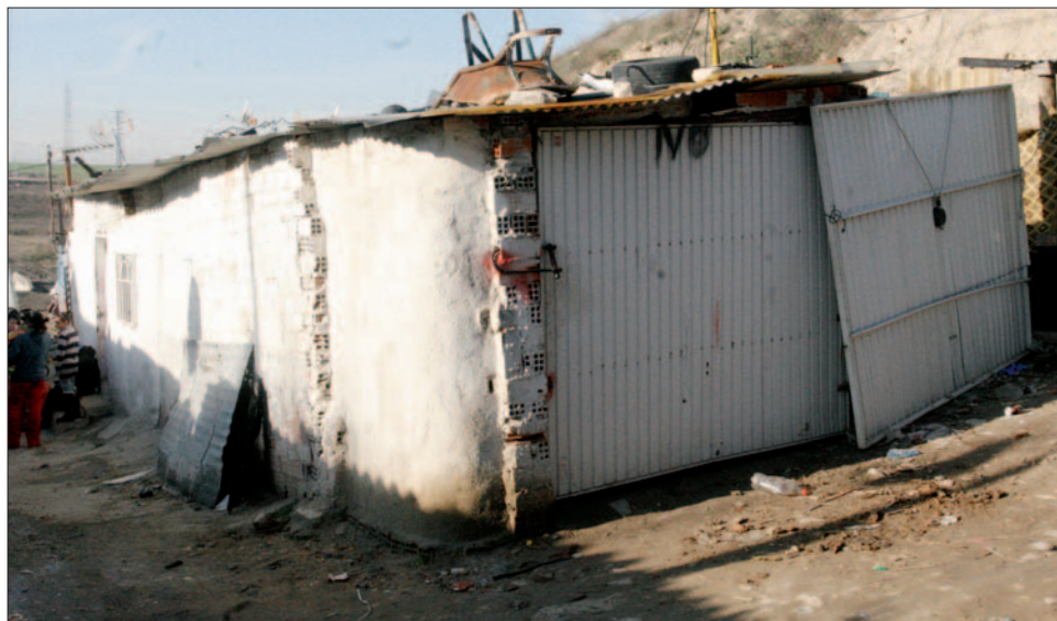
Las casas en el poblado son de papel y los tejados vuelan si no se sujetan.