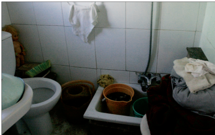
Un baño de una casa en El Ventorro (quien tiene). / David Calle