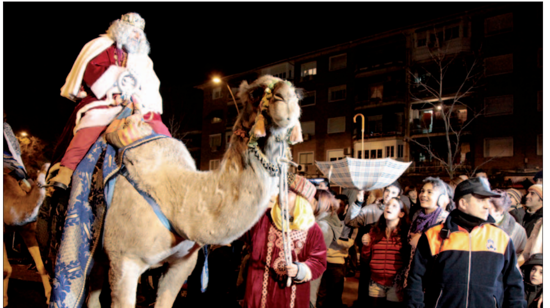
Melchor, Gaspar y Baltasar se pasearon en camello por el centro de la ciudad ante la admiración de los presentes.