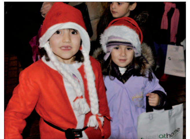
Feel At Home y otros comercios, en ruta con Papa Noel.