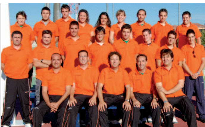
Grupo de técnicos del club.

que al tenis. Ha tenido una acogida enorme, en especial en el sector femenino". Con 300 personas aprendiendo esta modalidad, ya se han creado tres equipos mixtos que comenzarán a participar en diferentes competiciones. Las cuatro pistas viejas del polideportivo se han remodelado y se han construido tres más.