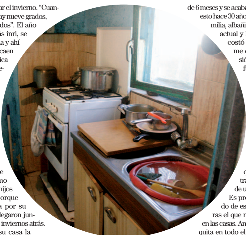
Una cocina de una chabola.

Todos en este poblado tienen una historia dramática detrás. Son personas con muy bajos recursos económicos que han llegado por diferentes razones, muchos no han conocido otra cosa. De hecho, como explica Nica, hay casas que ya han pasado de padres a hijos. Encarna pagaba un alquiler en Villaverde que tenía al día pero su casero quiso echarla, bajo denuncia, para