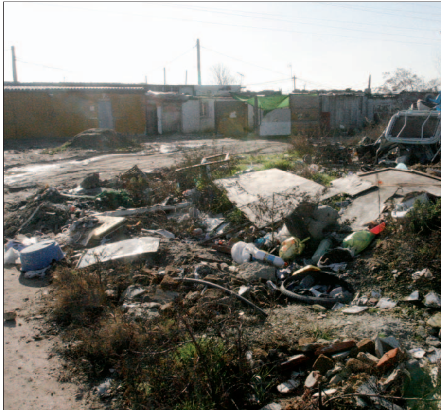
Vista del asentamiento chabolista El Ventorro desde la carretera M-301.