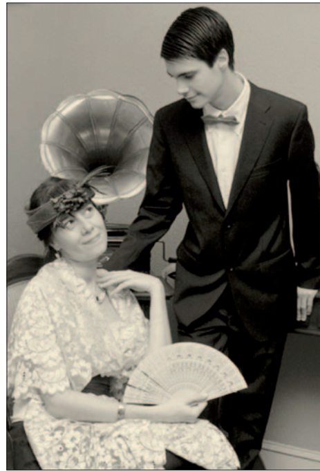
Momento de la representación de El Trepá.

rectora de La escena roja. El Trepá cuenta la historia de Christian Maske, un joven que no duda en borrar hasta el último rastro de su humilde origen para conquistar el poder, medrando