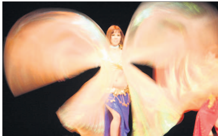
Uno de los bailes de Xatafi en Danza, habitual en el Hecho en Getafe. / Xatafi en Danza

La compañía Xatafi en Danza propone un espectáculo totalmente diferente al visto en otras ocasiones. Bajo el título de Sha-Hára , unas 45 bailarinas "y un chico" (novedad) representarán sobre las tablas 16 coreografías (14 de enero, 21.00 h.). "Este año no va a ser tan oriental como otras veces", explica la directora Esther Vindel. Introducen en esta ocasión la música rumana, también por primera vez incluyen música medieval andalusí y la guitarra de Paco de Lucía y como novedad también se recitarán cuentos cortos y leyendas árabes mientras las artistas están en movimiento. "Habrá una gran variedad de estilos, no será un espectáculo tan clásico como otros años". Aparte, y ya más habitual en la compañía, se verán velas, Alas de Isis y sables en un espectáculo que siempre resulta ameno y muy visual. En este sentido ayuda el vestuario, que continuamente se están cambiando las bailarinas y que corresponde a cada estilo. "No se repite ningún traje", manifiesta la directora al tiempo