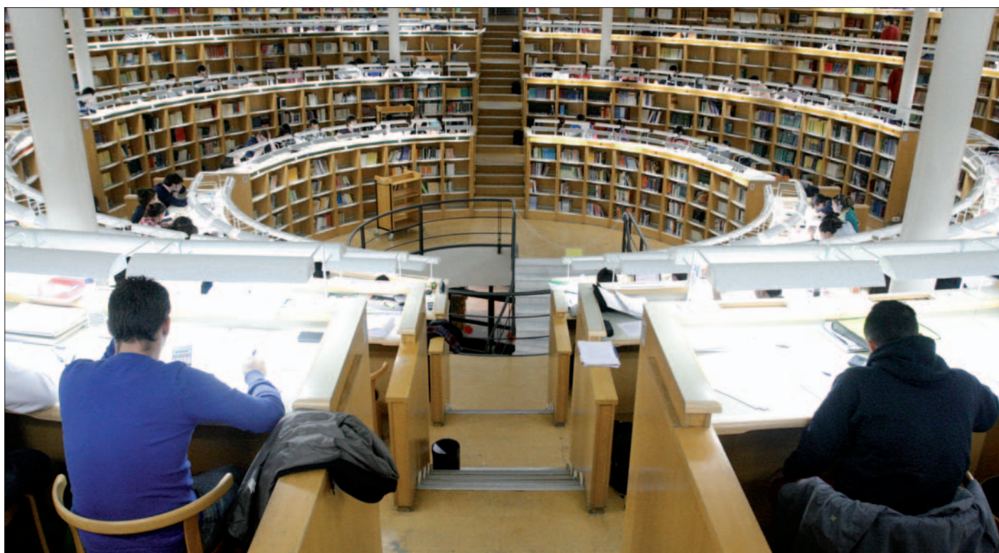
Cientos de estudiantes universitarios acuden en enero y en junio a la biblioteca de Ciencias Sociales y Jurídicas María Moliner, en la Universidad Carlos III.