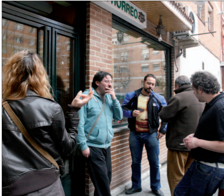
Un grupo de personas fuma sus cigarrillos en la puerta del bar

550 locales de hostelería en Getafe (42.000 en la Comunidad de Madrid) tienen vetado el tabaco en su interior desde que el 2 de enero entrara en vigor la nueva Ley Antitabaco, que prohíbe el humo en bares, restaurantes y salas de fiesta así como en los accesos a hospitales y colegios. En general, en la ciudad la norma se está cumpliendo (salvo alrededor de los centros escolares, donde se siguen viendo pitillos). Van 10 días. Llueva o haga frío el fumador tiene que salir a la calle y ha nacido con ello una nueva forma de relacionarse que ellos mismos verifican (buscan el lado positivo), y la forma de entablar conversación es precisamente el debate sobre la prohibición. ¿Era este el momento? Según la Asociación Empresarial de Hostelería de la Comunidad de Madrid La Viña el sector va a ver reducida su facturación en un 10% en este 2011. Ya se está notando, y eso que ha habido fiestas entre medias, durante estos primeros días de aplicación está habiendo “una cierta bajada en las consumiciones, especialmente en la sobremesa”, así como en “el tiempo de consumición por parte de los clientes”. Y estamos en crisis. Esta es la sensación general. Lo que sí han aumentado son las ventas de las llamadas setas, las estufas de terraza, en un 400%.