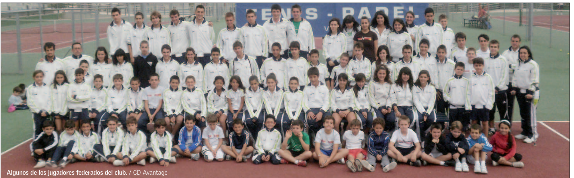
Algunos de los jugadores federados del club.