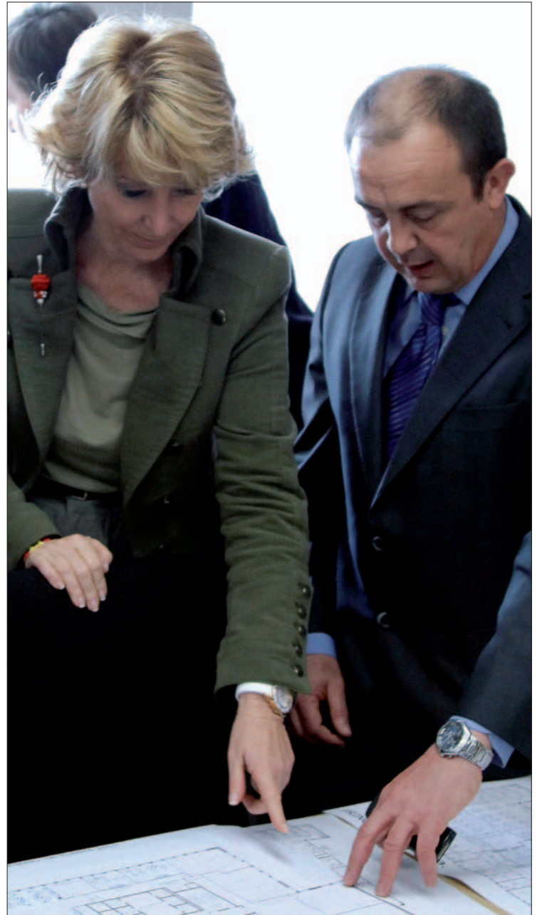
Esperanza Aguirre visita los nuevos juzgados de la calle Princesa, 3.

La oposición ve positiva la creación de estos 20 juzgados, pero puntualiza: "El Tribunal Superior de Justicia pedía más de 60 juzgados para la región pero a la hora de ponerlos en funcionamiento el Gobierno regional ha sido incapaz de llegar a crear un tercio de los autorizados por el Ministerio de Justicia, por lo que municipios como Móstoles o Navalcarnero no disponen aún del juzgado que había sido previsto para su partido judicial", explica el diputado socialista Javier Gómez. Los 10 juzgados