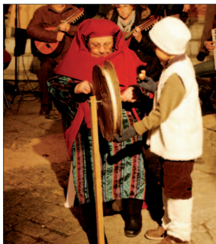
Belén viviente de la Casa de Extremadura.