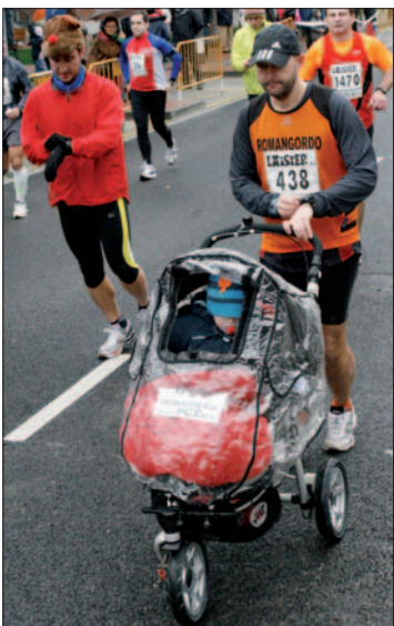
31 de diciembre, San Silvestre. / David Calle