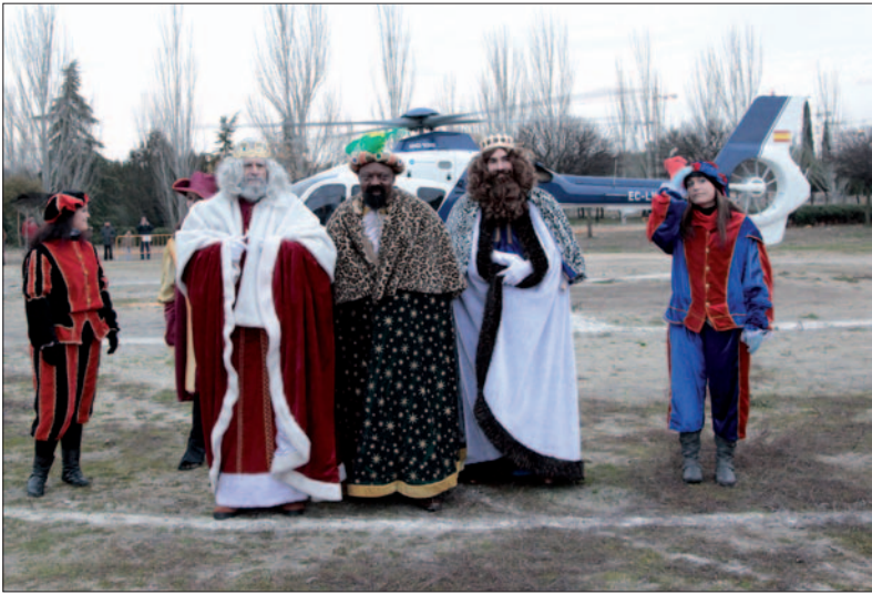
Los Reyes Magos llegaron en helicóptero a la plaza de toros.