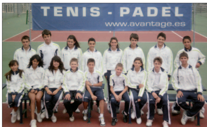
Integrantes del equipo infantil. / CD Avantage