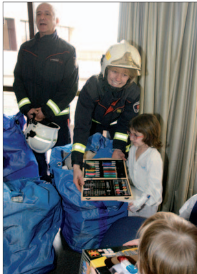
Los bomberos visitaron el hospital.

Carbón o regalos. Los Reyes Magos vaciaron sus sacos en Getafe y volvieron a Oriente y tras su marcha, acabaron las Navidades, terminaron las fiestas, vuelta al trabajo y al cole y hasta el próximo año. En esta ocasión la Navidad no fue blanca en la ciudad, aunque vino con frío y también con novedades, como una pantalla gigante para retransmitir la cabalgata real o un belén de plastilina que destacaba entre los habituales viviente o murciano. Hubo teatro, actividades, cotillones o la San Silvestre, y en cuanto a seguridad, diciembre se ha cerrado con un descenso del 13% de delitos.