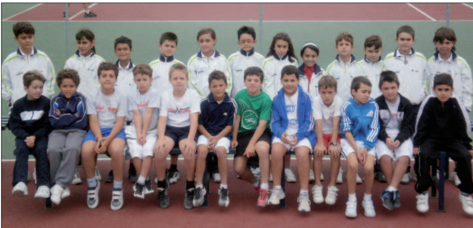
Miembros del equipo alevín, en el que se incluyen benjamines. / CD Avantage

para acercar el deporte de forma gratuita a ciertos sectores de la sociedad como la mujer, la infancia o los discapacitados", explica Rodríguez, que puntualiza que Avantage es "el único club de Madrid que cuenta con una sección de tenis en silla", en la que hay inscritas 14 personas. Aunque disfruta con todo el trabajo, son estas promociones las que suponen "una mayor satisfacción personal por el agradecimiento que demuestra la gente".